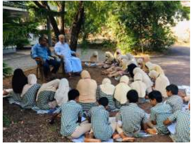
നാട്ടുകൂട്ടത്തിൽ കുഞ്ഞിമാമു മാസ്റ്റർ