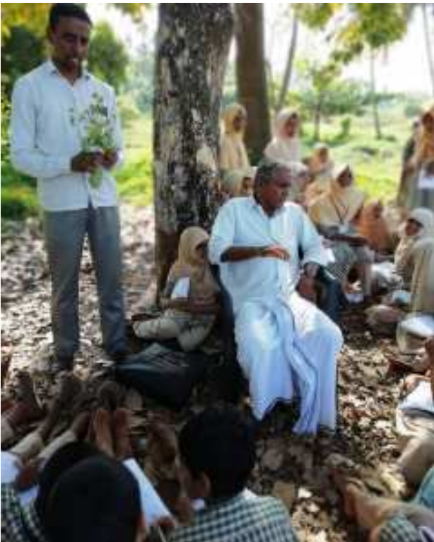
രാജൻ ഗുരുക്കളുമായി ഒരു അഭിമുഖം