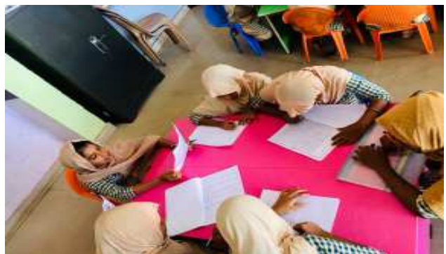
കുട്ടിചരിത്രകാരന്മാർ ചരിത്രം രചിക്കുന്നു