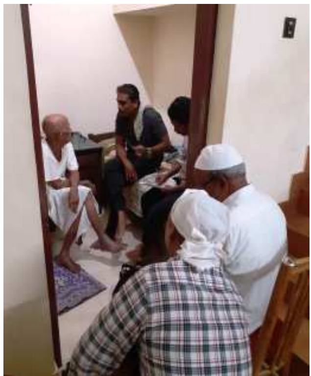
100 നോട്ടുത്ത അബൂക്കയുമായി ചരിത്രാനുഷ്ഠിതം