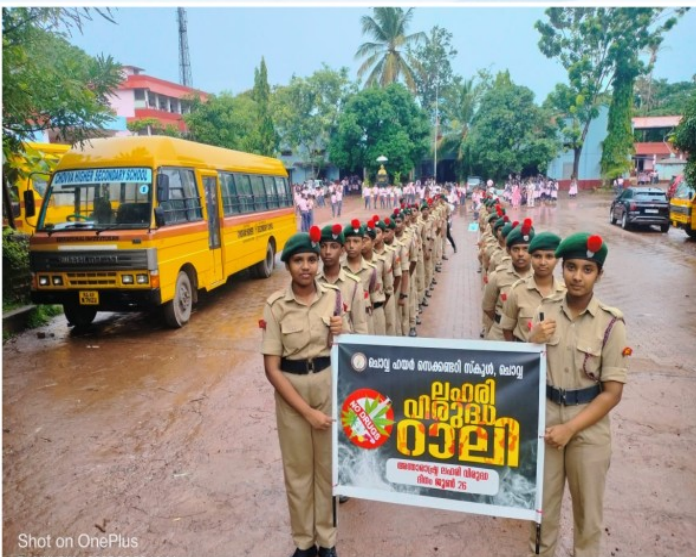
ലഹരി വിരുദ്ധ ദിനത്തിന്റെ ഭാഗമായി ചൊവ്വ ഹയർ സെക്കന്ററി സ്കൂൾ വിദ്യാർത്ഥികൾ നടത്തിയ ലഹരിവിരുദ്ധ റാലി