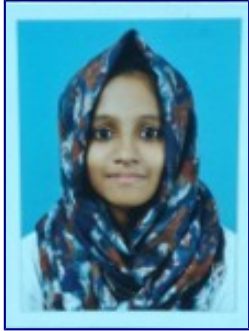
റിയ. പി 8 സി