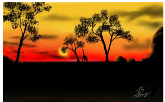
Pranay P P