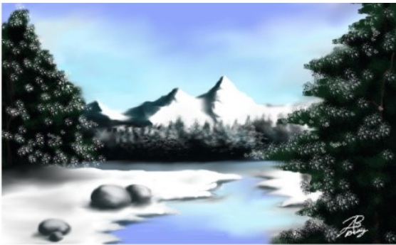
Pranay P P