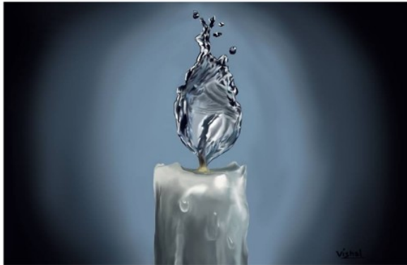
Vishal K V