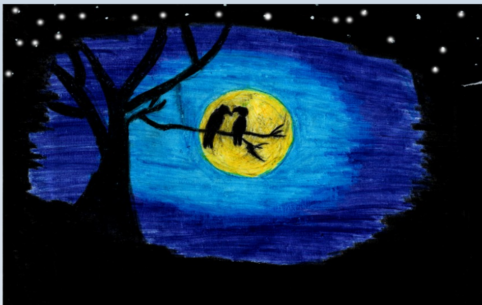
KRISHNA PRASAD K K 8 C