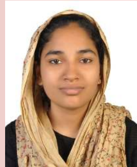
ജഹിബ മണപ്പാട്ട് HST MALAYALAM

ഓർത്തെടുക്കൽ, എഴുത്ത്, കൈവേദന, ഒരേയിരിപ്പ്, മുഷിപ്പ്, പരീക്ഷയെപ്പറ്റി വാചാലരായി കുഞ്ഞുങ്ങൾ.