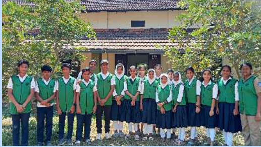
OUR GREEN CLUB