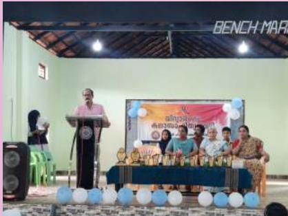
വിദ്യാരംഗം കലാ സാഹിത്യ വേദി ഉദ്ഘാടനം