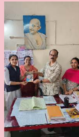
പിറന്നാൾ പുസ്തകം പദ്ധതി