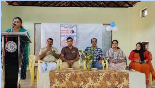
ജാഗ്രതാ സമിതി ഉദ്ഘാടനം