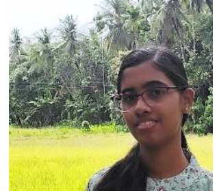
തേജ രാജ് ഒ 10 C

തരുവായ് പടർന്നിടാം തണൽ വിരിച്ചിടാം നിന്നോട് ചേർന്നിടാം.