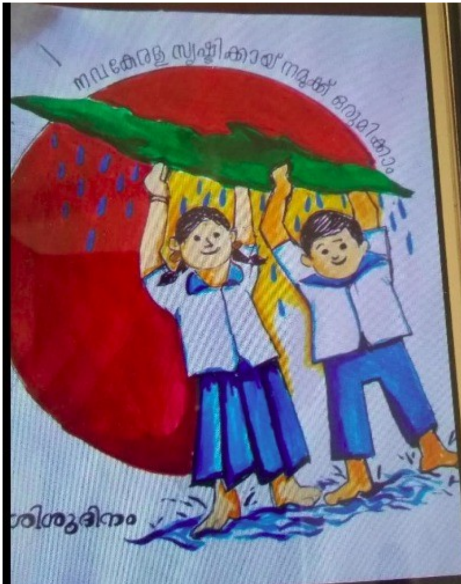
ഗവ ഹയർസെക്കന്ററി സ്കൂൾ അരോളി ലിറ്റിൽ കൈറ്റ്സ്