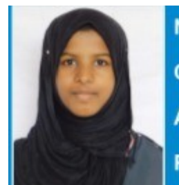
ഫാത്തിമത്തുൽ സന പി