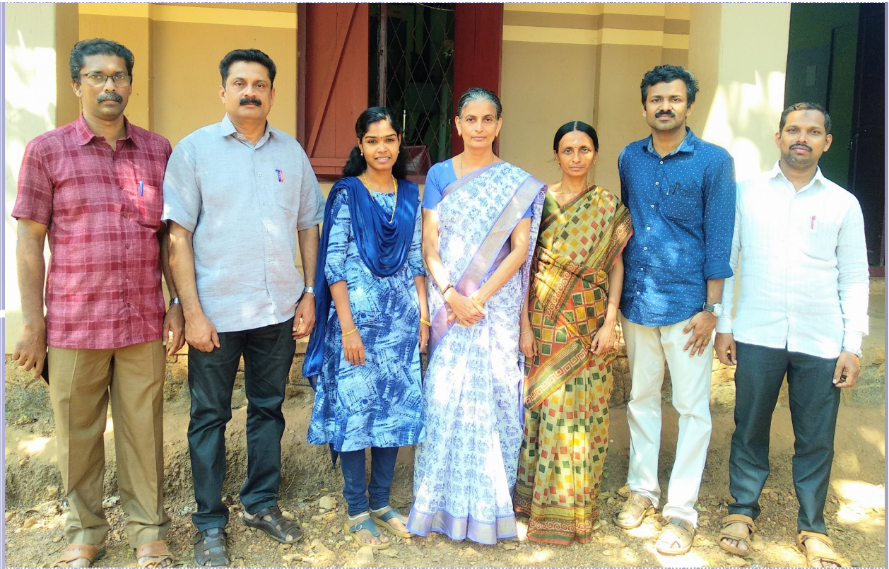
PROOF READING AND SUPPORT