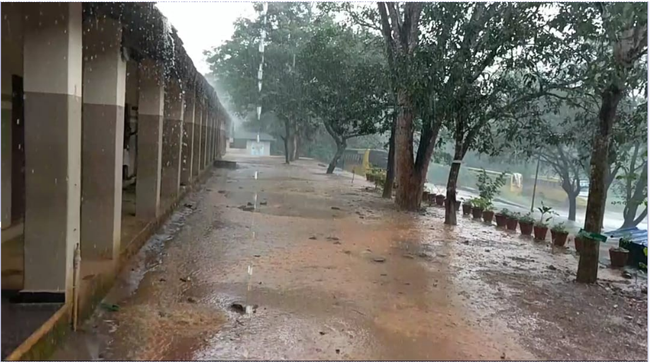
മഴ നന്നത്ത പുമരങ്ങൾ ....