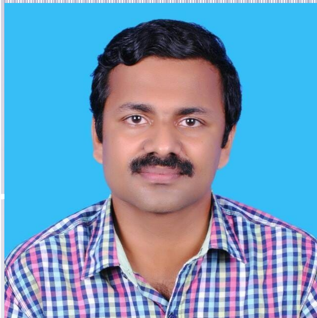
COVER PAGE DESIGNING