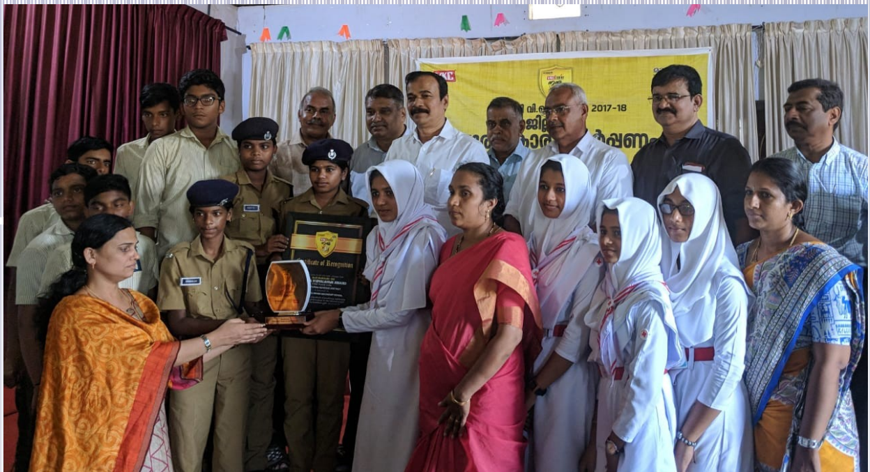
മാതൃഭൂമി VKC നന്ന വിദ്യാലയ പുരസ്കാരം നാരോക്കാവ് സ്കൂൾ ഏറ്റെടുത്തു