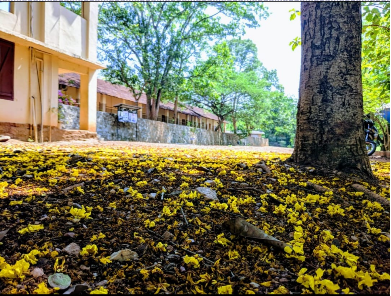
മനസ്സുപോലെ പൂക്കുകയാൽ .....