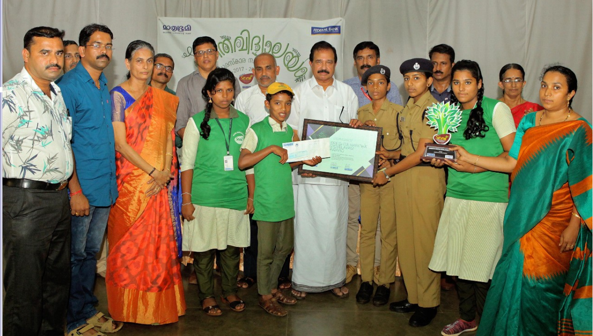
മാതൃഭൂമി സീഡ് ജില്ലാതല ഹരിത വിദ്യാലയ പുരസ്കാരം നാരോക്കാവ് സ്കൂൾ ഏറ്റെടുത്തു.