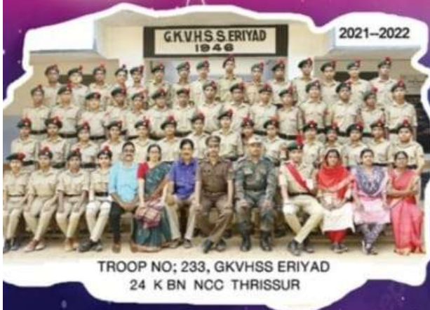
TROOP NO; 233, GKVHSS ERIYAD 24 K BN NCC THRISSUR