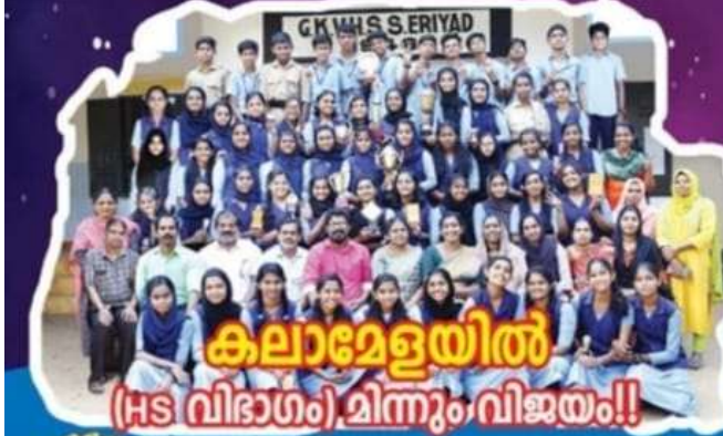
കലാമേളയിൽ (HS വിഭാഗം) മിന്നും വിജയം!!