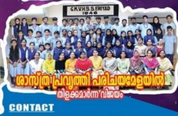
ശാസ്ത്ര പ്രവൃത്തി പരിചയമേളയിൽ തിളക്കമാർന്ന വിജയം