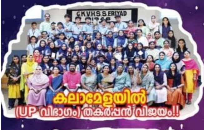
കലാമേളയിൽ (UP വിഭാഗം) തകർപ്പൻ വിജയം!!