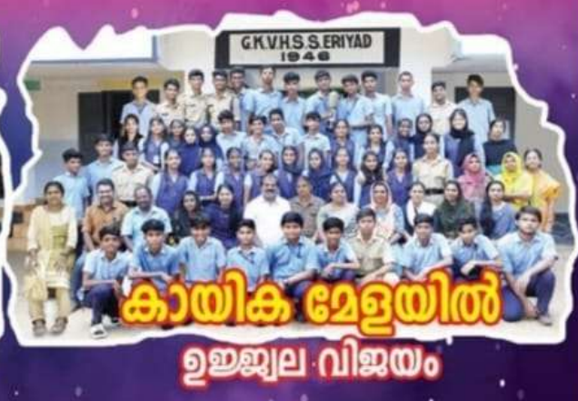
കായിക മേളയിൽ ഉജ്ജ്വല വിജയം