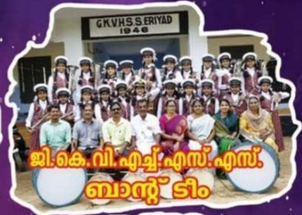
ജി.കെ.വി.എച്ച്.എസ്.എസ്. ബാന്റ് ടീം