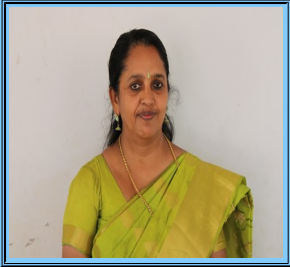
അനമ്മ ബോർമ്മൂട്ട് (എച്ച്.എം)

കടലാഴങ്ങളെ സ്വപ്നങ്ങളിൽ ഒളിപ്പിച്ച് അറിവിൻ മുത്തുകൾ തേടിവന്ന പൊള്ളേത്തെയുടെ മനസ്സും ചിന്തയുമായി ഞങ്ങൾ എഴുത്തിന്റെ മായിക ലോകത്തിലേക്ക് എത്തിയിരിക്കുകയാണ്. ഓരോരുത്തരുടേയും അനുഭവത്തിന്റെയും കാഴ്ചയുടെയും ലോകമാണ് ഇവിടെ നിങ്ങൾക്കായ് തുറന്നിടുന്നത്. സമകാലീന പ്രശ്നങ്ങളും ഭാവനയും യഥാർത്ഥകാര്യങ്ങളും നിറഞ്ഞ അവതരണം. ഓരോ ക്ലാസ്സ് തല പ്രവർത്തനങ്ങളോടൊപ്പം മറ്റു സൃഷ്ടികൾ കൂടി ഉൾപ്പെടുത്തിയാണ് ഈ വാർഷിക പതിപ്പ് തയ്യാറാക്കിയിട്ടുള്ളത്. കവി പറഞ്ഞതുപോലെ ഇവിടെ ഉണ്ടായിരുന്ന എന്നതിന് തെളിവായി കിളികൾ ഒരു രൂവൽ പൊഴിച്ചിടുന്നതു പോലെ ഞങ്ങളും പൊള്ളേത്തെയുടെ വിരിമാറിലൂടെ സഞ്ചരിച്ചിരുന്ന എന്നതിനായി ഇവിടെ അവശേഷിപ്പിക്കുന്ന ഒരു തെളിവാണു് 'വർണ്ണചെപ്പ്'. ഇതിന്റെ ഓരോ താളിലൂടെയും യാത്ര ചെയ്യാൻ ഏവരെയും ഹൃദയപൂർവ്വം ക്ഷണിക്കുകയാണ്..... അഭിനന്ദനങ്ങൾക്കും വിമർശനങ്ങൾക്കും കാര്യങ്ങൾക്കൊണ്ട് ഇവിടെ ഞങ്ങളുണ്ട്.. ... ചീഫ് എഡിറ്റർ