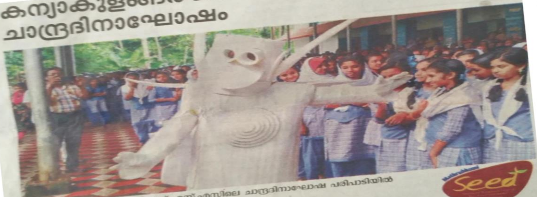
കന്യാകുളങ്ങര ഗേൾസ് എച്ച്.എസ്.എസിലെ ചാന്ദ്രദിനാഘോഷ പരിപാടിയിൽ ചാന്ദ്രമനുഷ്യൻ വിദ്യാർഥിനികൾക്കൊപ്പം

വെമ്പായം ▶ കന്യാകുളങ്ങര ഗേൾസ് എച്ച്.എസ്.എസിൽ മാതൃഭൂമി സീഡ് ക്ലബിന്റെയും സയൻസ്, സോഷ്യൽ നേതൃത്വ ക്ലബ്ബുകളുടെയും ഘോഷം സമ്മേളനം ചാന്ദ്രദിനാഘോഷം സംഘടിപ്പിച്ചു. ശാന്തസാഹിത്യ പരിഷത്ത് അവതരിപ്പിച്ച ചാന്ദ്രമനുഷ്യൻ പരിപാടി ഓറാറ്റർമാർക്ക്