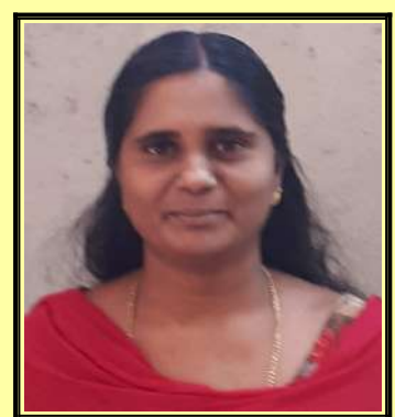
മേരിഷിജി ഇ ഐ ടി കോർഡിനേറ്റർ