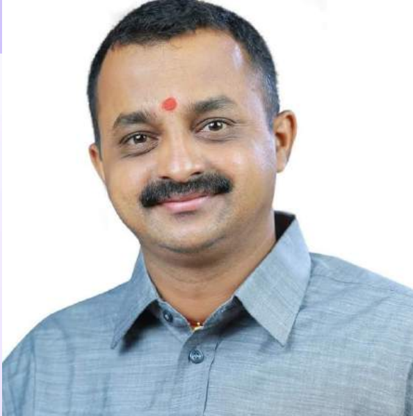
ശ്രീ ജ്യോതിസ് വാർഡ് കൗൺസിലർ