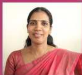
സിന്ധു കിഴക്കൈകുനി (കൈറ്റ് മിസ്ട്രസ്സ്)