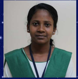
ശിവ . എം 9P