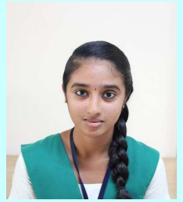
വൃന്ദ . ടി 8.M