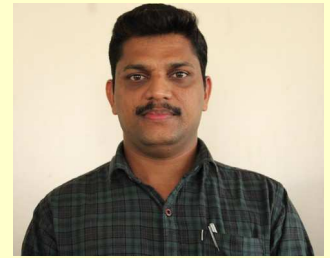
ഹാരിസ് . ഒ

മഴ കാണാൻ കൊതിക്കുന്നൊരു മനസ്സ് മഴ പോലെയെന്നിൽ പെയ്യും മനസ്സും മനസ്സിനെ പിടിച്ച് വെക്കാൻ കഴിയുന്നില്ല , ഒരു നേർത്ത തെന്നലിന്റെ അകമ്പടിയോടെ ഒരു ചാറ്റൽമഴ പോലെ എന്നിലേക്കണഞ്ഞിട്ട് ഒരു ചെറുജാലകത്തിലൂടെ ഏറെനേരം നോക്കി ഒടുവിലെപ്പോഴാണ് നീ പെയ്തു തുടങ്ങിയത്?