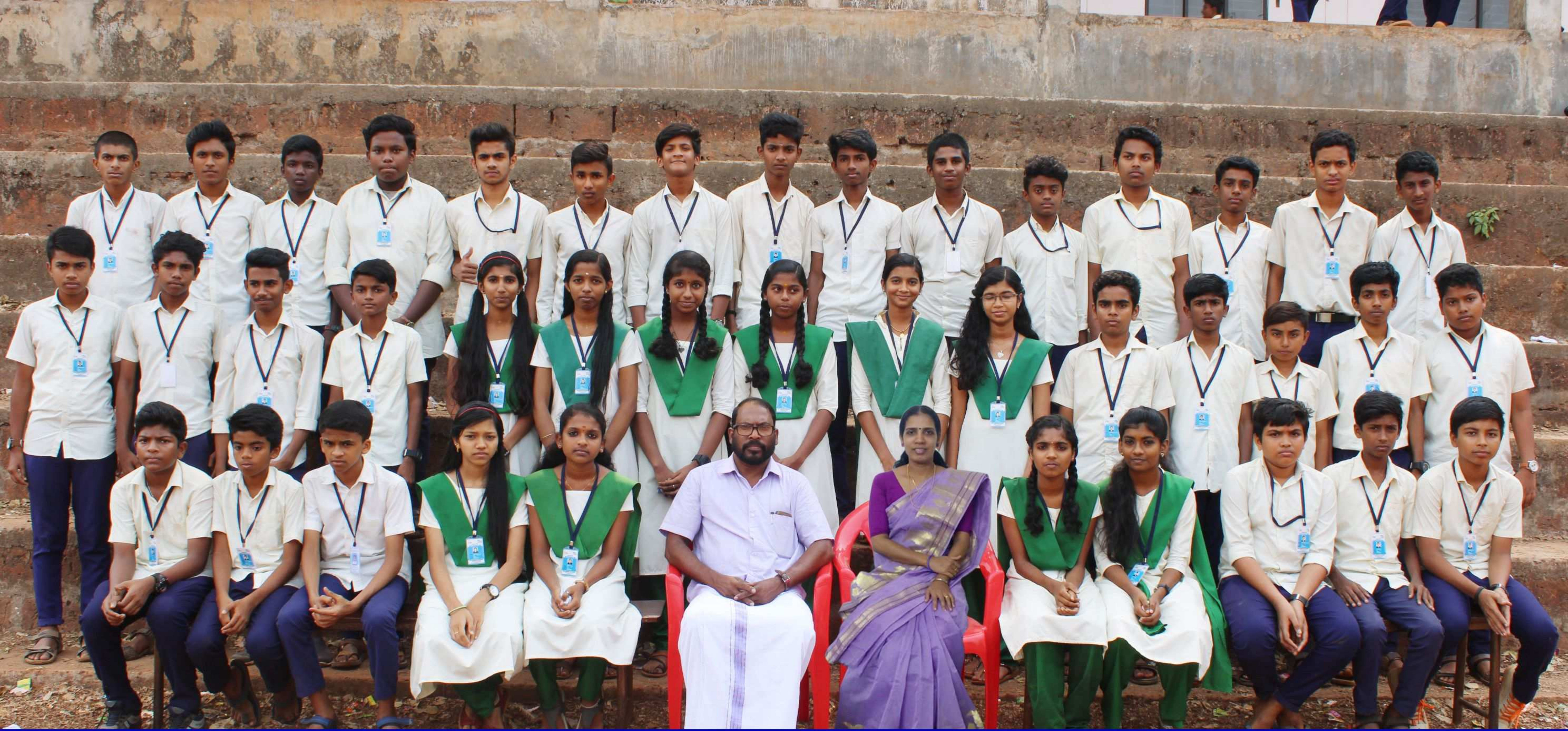
Little Kites GGVHSS, FERROKE