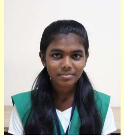
ശോപിക വി 8 M

സൂര്യകിരണങ്ങൾ തൊട്ടണർത്തുന്ന പുലർവേളയിൽ മധുരമാം കിളിയുടെ നാദം വിളിപ്പു..... പുണരന്നു പകലിൻ വെളിച്ചം ഒരുയിർത്തെഴുന്നേല്പിന്റെ ശാന്തിയോടെ മനസ്സാകെ നിറഞ്ഞുണരമ്പോൾ കേൾക്കുന്ന നാദത്തിൽ അലിഞ്ഞു ഞാൻ നടപ്പു ..... കാഴ്ചയാണ് എന്റെ പ്രകൃതി ..... തുമഞ്ഞു നൽകുന്ന വിറയാർന്ന കുളിരം സൂര്യൻ നൽകുന്ന ചെറുചുട്ടം ഇളം കാറ്റിൽ കൊഴിയുന്ന ഇലകളും എന്നെ തൊട്ടു തലോടി ഒഴികിട്ടുന്ന മഞ്ഞുപെയ്യുന്നൊരാ വശ്യതയിൽ മണിപ്പു കൊഴിയുന്ന സായാഹ്നത്തിൽ അവനെന്റെ കണ്ണിൽ പതിഞ്ഞു .... അറിയാതെ എൻ മുഖത്തു ഒരു ചെറു പുഞ്ചിരി വിടർന്നു അകലുകയായിരുന്നു എന്നിൽ നിന്നെന്നറിയാതെ അവനെ എന്നും സ്നേഹിപ്പു ഞാൻ അകലുന്നൊരാ നിമിഷം വിരഹം തൊട്ടുവിളിക്കുന്നൊരാനിമിഷം ഞാൻ ഉണർന്നു എൻ സ്വപ്നത്തിൽ നിന്ന്