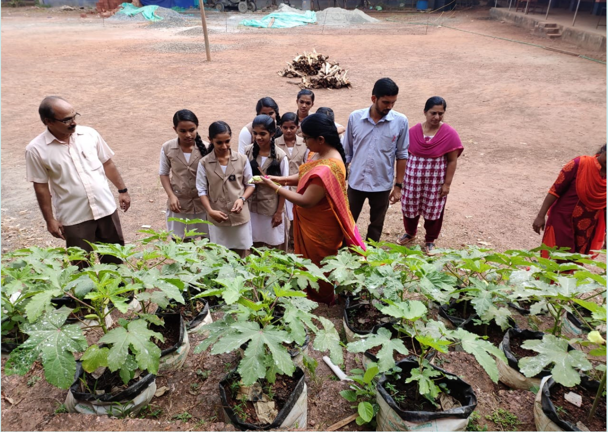
പച്ചക്കറി കൃഷി വിളവെടുപ്പ്