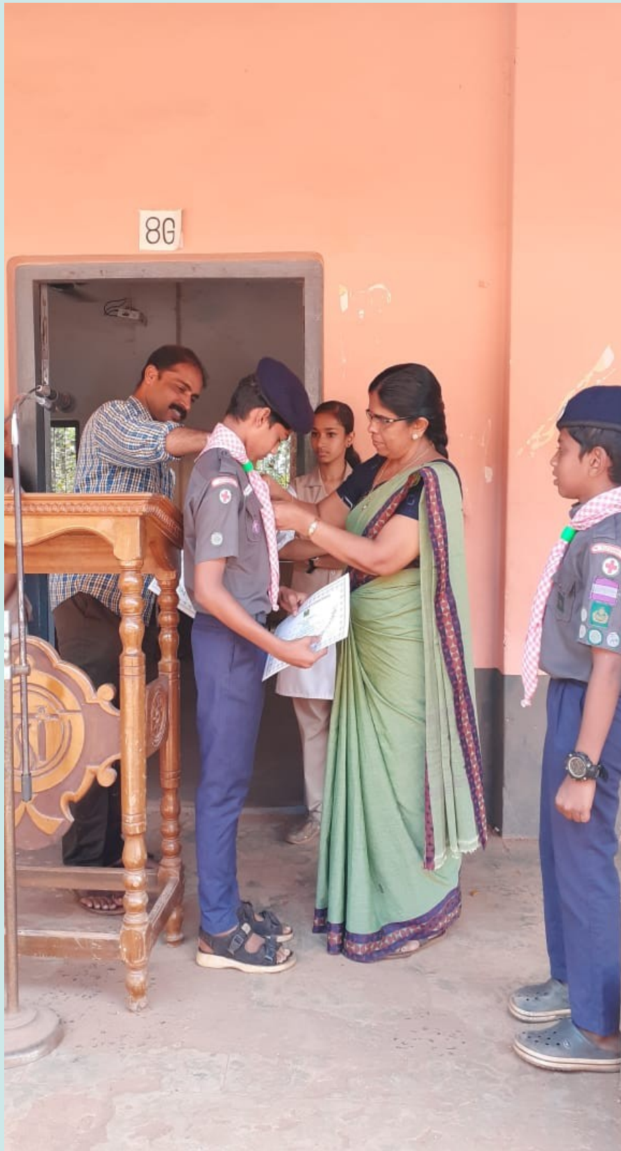
രാജ്യപുരസ്കാര അവാർഡ് ദാനചടങ്ങ്