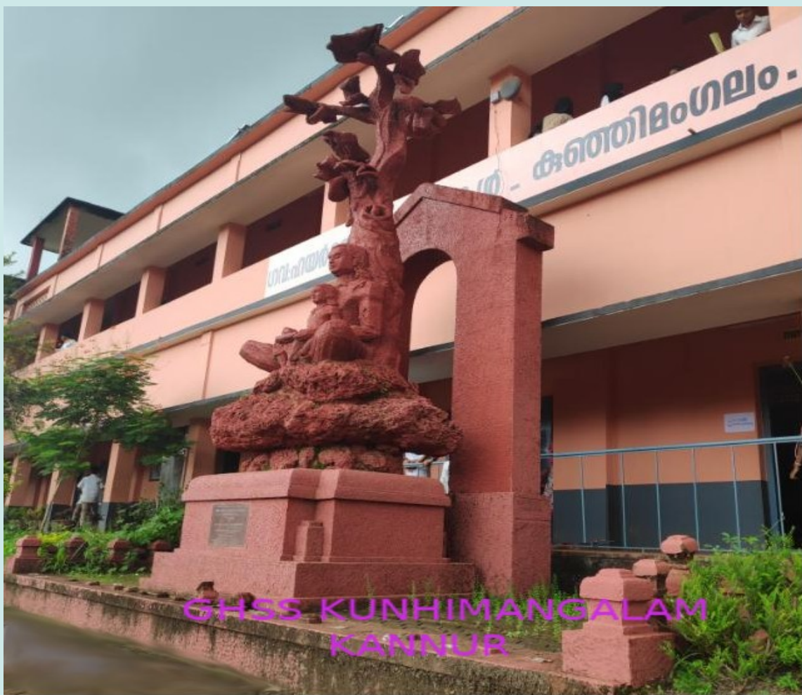
GHS KUNHIMANGALAM KANNUR