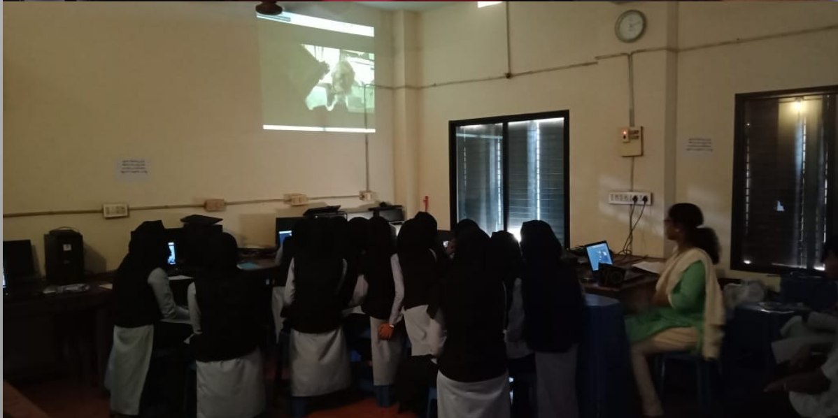
Little Kite Sub-district Participant