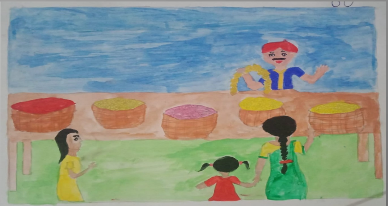
Absheera A 8B