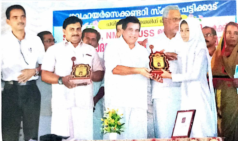
എസ്.എസ്.എൽ.സി., +2 ഫുൾ എ റ്റുവിജയികൾക്കുള്ള അനുമോദനം