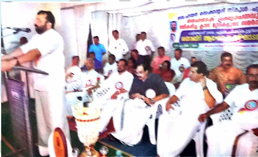
സ്കൂൾ അലുംനി അസോസിയേഷന്റെ നേതൃത്വത്തിൽ നവീകരിച്ച ക്ലാസ് നൂറുകളുടെ കൈമാറ്റം ബഹു. സ്പീക്കർ പി. ശ്രീരാമകൃഷ്ണൻ നിർവ്വഹിക്കുന്നു.