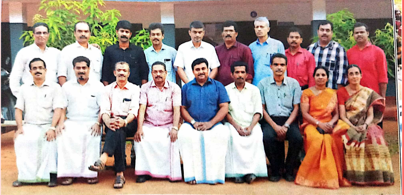
സ്കൂളിന്റെ സമഗ്ര വികസനത്തിന് നേതൃത്വം നൽകിക്കൊണ്ട് എന്നും ഞങ്ങളോടൊപ്പമുള്ള അധ്യാപക - രക്ഷാകർതൃ സമിതി