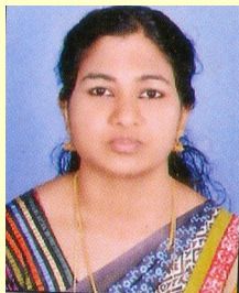
മജ്ജല റ്റി. ഗാന്ധിദർശൻ