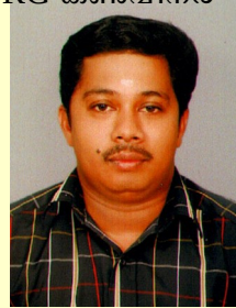
വിനോദ് പി. വി. കൃഷി, പരിസ്ഥിതി