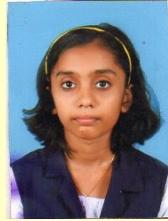
നിരഞ്ജനാനാം ആർ.എ. VIII B