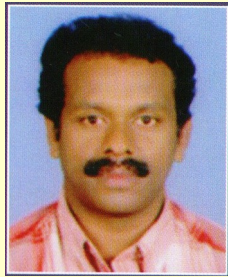
സുനിൽകുമാർ വി. സ്കൂൾ ബസ്