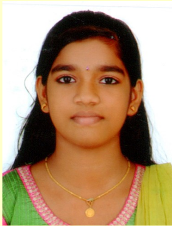
അക്ഷരാത്മിക എ.എം. IXB