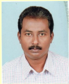
പ്രകാശ്റോബർട്ട് കൈറ്റ് മാസ്റ്റർ