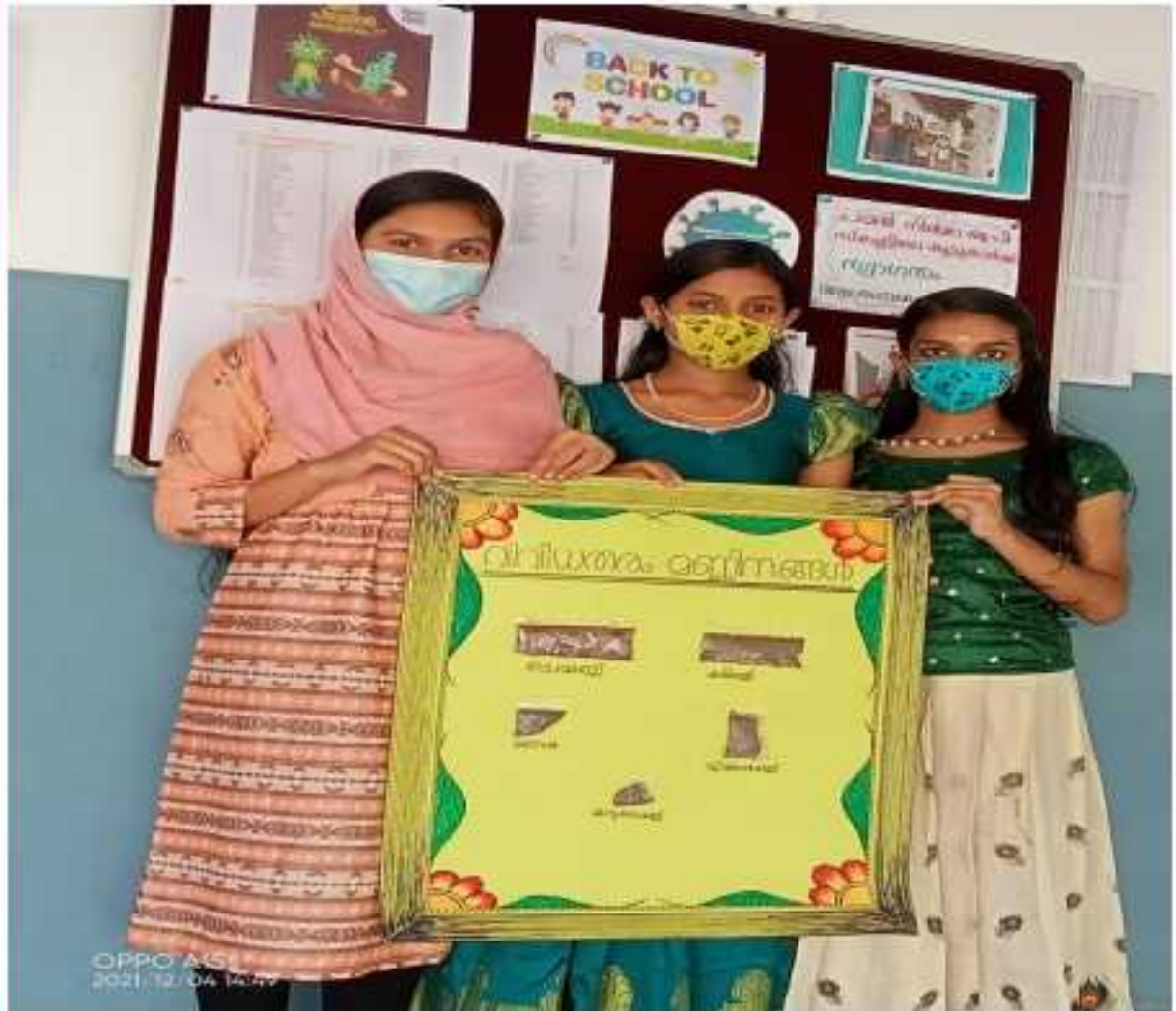
ഡിസംബർ 10 Human Rights Day