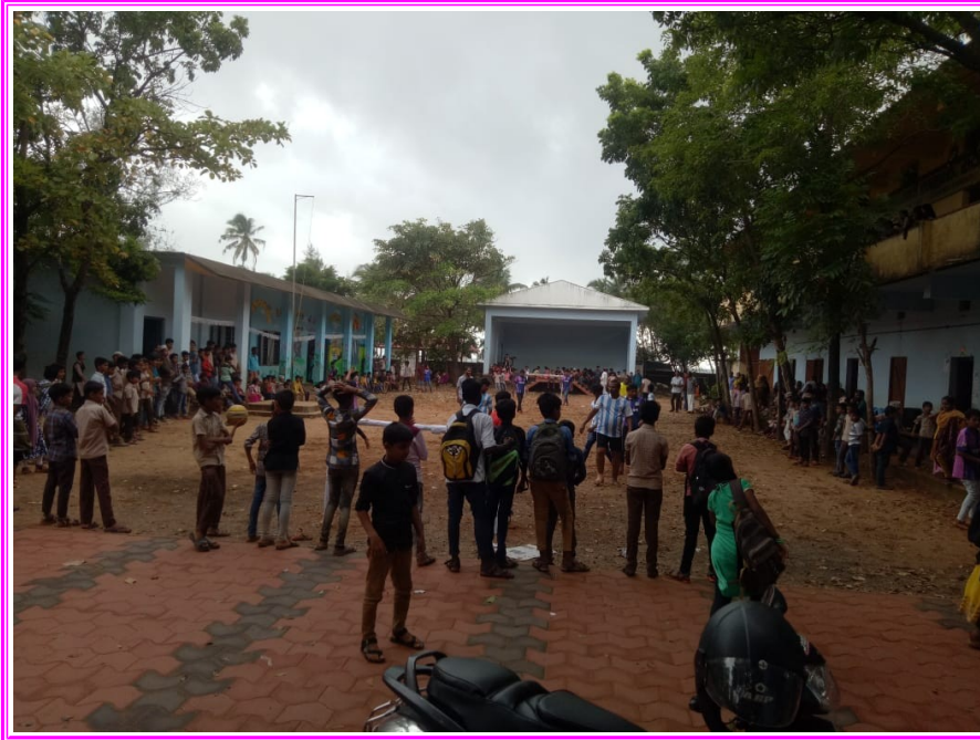
സ്കൂൾ പ്രവർത്തന കാഴ്ചകൾ