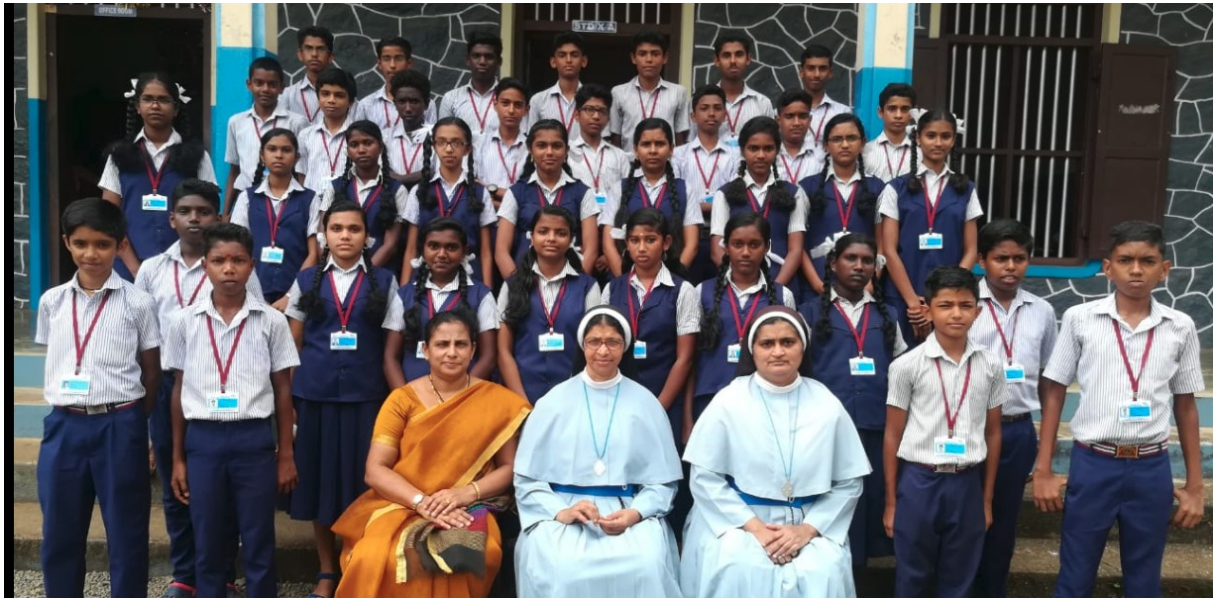
ലിറ്റിൽ കൈറ്റ്സ് 2018-19