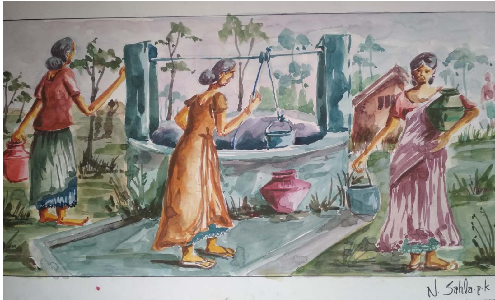
എൻ സഹല പി കെ