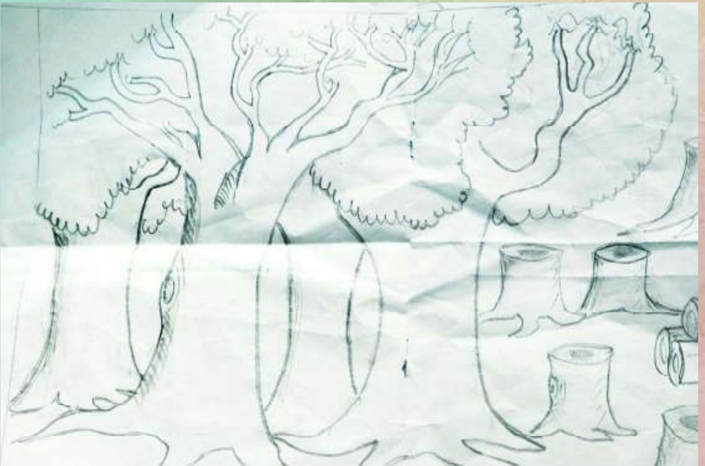
Illustration: Muhammed Fahad-9 E