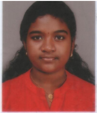
ആവണി അനിൽ IX B

ഒരിക്കൽ ശർക്കരക്കാട്ടിലെ ഉറസുഹൃത്തുക്കളായിരുന്നു ആനയും കുരങ്ങനും. ആനയുടെ പേര് സോമനെന്നും കുരങ്ങന്റെ പേര് മിട്ടുവെന്നുമായിരുന്നു.ഒരുനാൾ അവർ രണ്ടുപേരും തീറ്റതേടി നടക്കുകയായിരുന്നു. തീറ്റതേടി നടന്ന് ഒരു ദുഷ്ടനായ വേട്ടക്കാരന്റെ തോട്ടത്തിൽ കയറിപ്പോയിരുന്നു.അവിടെ നിറയെ വാഴത്തോട്ടമായിരുന്നു.സോമനും മിട്ടുവും കൂടി പഴങ്ങൾ തിന്നാൻ തുടങ്ങി.വേട്ടക്കാരൻ നടന്നു വരുന്നു.വേട്ടക്കാരനെ കണ്ടതോടെ സോമനും മിട്ടുവും ഓടി.മിട്ടു ഓടി ഒരു മരത്തിന്റെ മുകളിൽ ഒളിച്ചു.സോമനെ വേട്ടക്കാരൻ ഓടിച്ചു.സോമനൊരു കുഴിയിൽ വീണു.സോമനെ രക്ഷിക്കാൻ ആരുമില്ലായിരുന്നു.ഉറസുഹൃത്തായ മിട്ടു ഒന്നും നോക്കാതെ മരത്തിന്റെ മുകളിൽ കയറി ഒളിക്കുകയും ചെയ്തു.വേട്ടക്കാരൻ ആനക്കൂട്ടനെ വെടിവെച്ചു കൊന്നു.