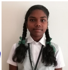
നിത്യ .ദി റെജി

അടുത്ത രാത്രി മോഷ്ടിച്ചവൻ തന്റെ കല്ലിൽ കൂടുതൽ സ്വർണ്ണം പൂശി. പിറ്റേദിവസം എല്ലാവരും തങ്ങളുടെ കല്ല് രാജാവിനെ കാണിച്ചു . അപ്പോൾ രാജാവിന്റെ ഒരു ജോലിക്കാരന്റെ കല്ലിൽ കൂടുതൽ സ്വർണ്ണം പൂശിയിരുന്നു . രാജാവ് പറഞ്ഞു "ഇവനാണ് കള്ളൻ ". രാജാവ് പറഞ്ഞു "എനിക്കറിയാമായിരുന്നു,കള്ളൻ വിധിയിൽ നിന്ന് രക്ഷപെടാൻ കൂടുതൽ സ്വർണ്ണം പൂശും,അതുകൊണ്ടാണ് ഞാൻ ഈ കൗശലം പ്രയോഗിച്ചത്".