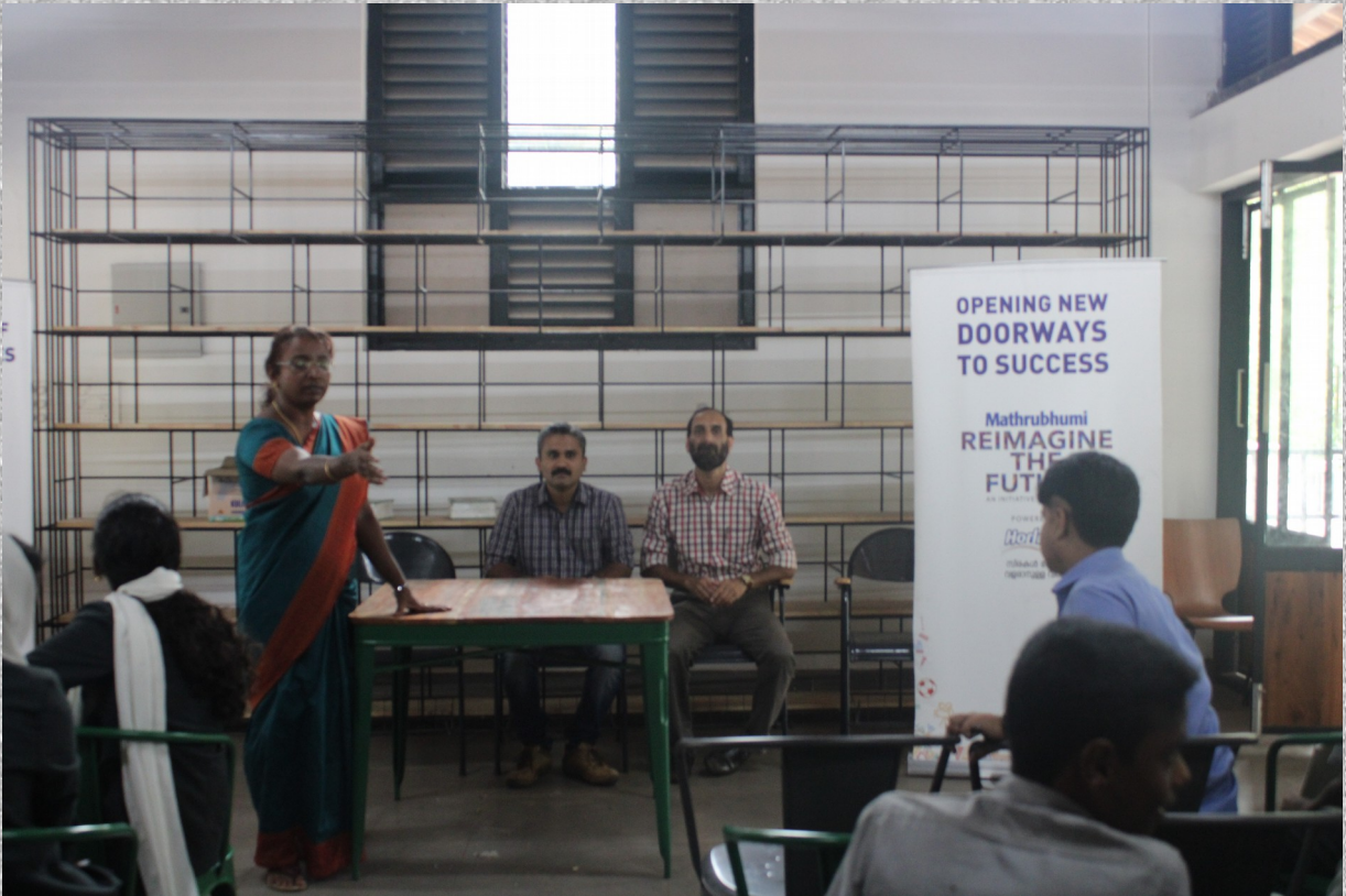
മാതൃഭൂമി ദിനപത്രം സബ്എഡിറ്റർ കരിയർ ഗൈഡൻസ് ക്ലാസ്സ് സംഘടിപ്പിച്ചു