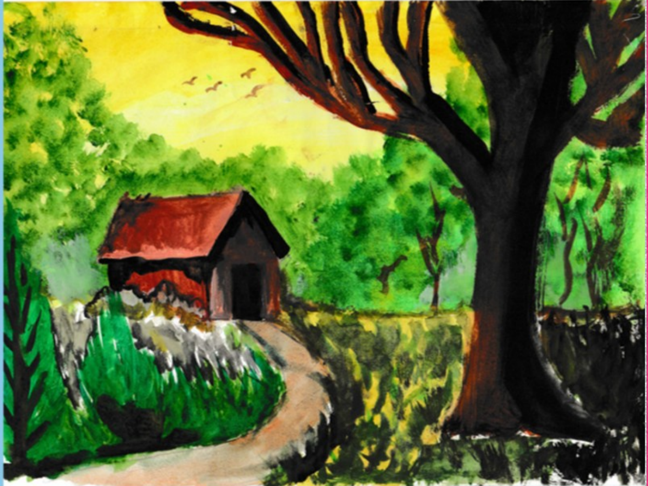
SAFEEQ AHAMMED VII