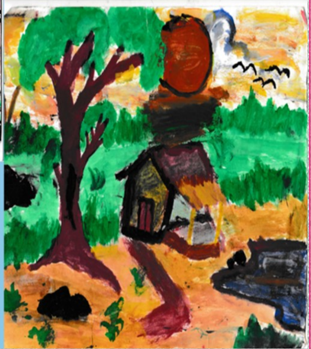
MUHAMMED ADNAN VI