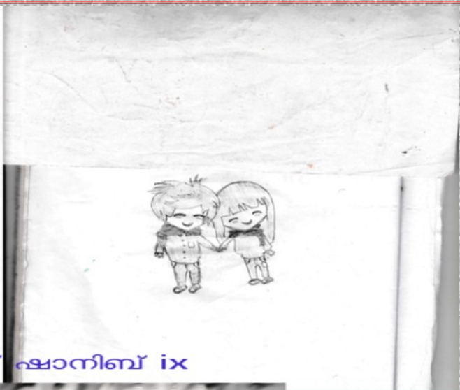
മുഹമ്മദ് ഷാനിബ് ix