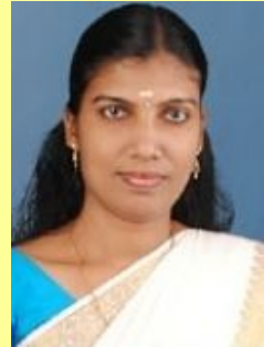
സ്റ്റാഫ് എഡിറ്റർ ജൂനിയർ ടീച്ചർ കൈറ്റ് മിസ്ട്രീസ്

നിങ്ങൾക്കു മുമ്പിൽ സ്നേഹപൂർവ്വം സമർപ്പിക്കുന്നു.