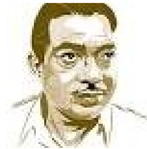
എസ്.കെ. പൊറ്റക്കാട് (1980)