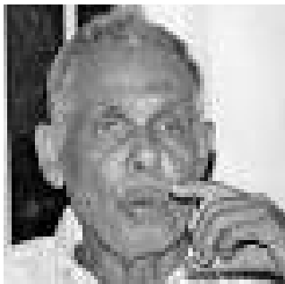
തകഴി ശിവശങ്കരപ്പിള്ള (1984)