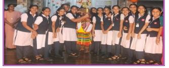
ഓവറോൾ രണ്ടാം സ്ഥാനം -X B