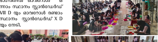
ഓവറോൾ ഒന്നാം സ്ഥാനം -VII E (UP)