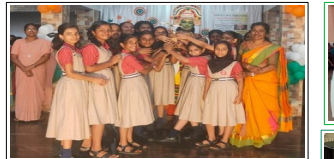
ഓവറോൾ ഒന്നാം സ്ഥാനം - VI E (UP)