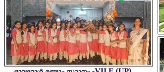
ഓവറോൾ രണ്ടാം സ്ഥാനം -VII E (UP)