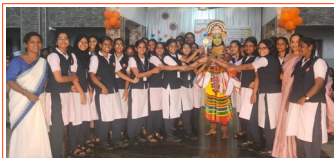
ഓവറോൾ ഒന്നാം സ്ഥാനം-XC&XF അധ്യാപകർക്കൊപ്പം