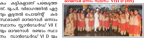
ഓവറോൾ ഒന്നാം സ്ഥാനം -VIII D (HS)

തോപ്പംപടി: സ്കൂൾതല പ്രവൃത്തിപരിചയ മേള യു.പി. വിഭാഗം മത്സരം ആഗസ്റ്റ് 5 നും ഹൈസ്കൂൾ വിഭാഗം മത്സരം ആഗസ്റ്റ് 6 നും സ്കൂൾ അങ്കണത്തിൽ നടന്നു. രണ്ടു വിഭാഗങ്ങളിലുമായി അഞ്ചുനിലയിൽ കുട്ടികളാണ് പങ്കെടുത്തത്. യു.പി. വിഭാഗത്തിൽ ഏറ്റവും കൂടുതൽ പോയിന്റ് കരസ്ഥമാക്കി ഓവറോൾ ഒന്നാം സ്ഥാനം സ്റ്റാൻഡേർഡ് VII E യും ഓവറോൾ രണ്ടാം സ്ഥാനം സ്റ്റാൻഡേർഡ് VI D യും കരസ്ഥമാക്കി. ഹൈസ്കൂൾ വിഭാഗത്തിൽ ഓവറോൾ ഒന്നാം സ്ഥാനം സ്റ്റാൻഡേർഡ് VIII D യും ഓവറോൾ രണ്ടാം സ്ഥാനം സ്റ്റാൻഡേർഡ് X D യും നേടി.