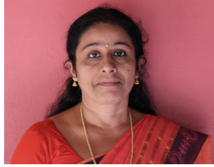
രാജ്ശ്രീ (Kite Mistress)