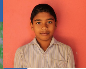
Asrar A 6B