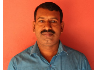
പ്രചോദ്.ടി (Kite Master)

കുട്ടികൾ നിർമ്മിക്കുന്ന ഡിജിറ്റൽ മാഗസിൻ എന്നത് നമ്മുടെ വിദ്യാലയത്തിൽ ഒരു പുതിയ സംരംഭമാണ് .സർഗാത്മകതയും സാങ്കേതികതയും കൈകോർക്കുന്ന ഈ അസൂലഭമുഹൂർത്തത്തിൽ ഇതിന്റെ അണിയറശിൽപ്പികൾക്ക് എല്ലാവിധ ആശംസകളും നേരുന്നു.