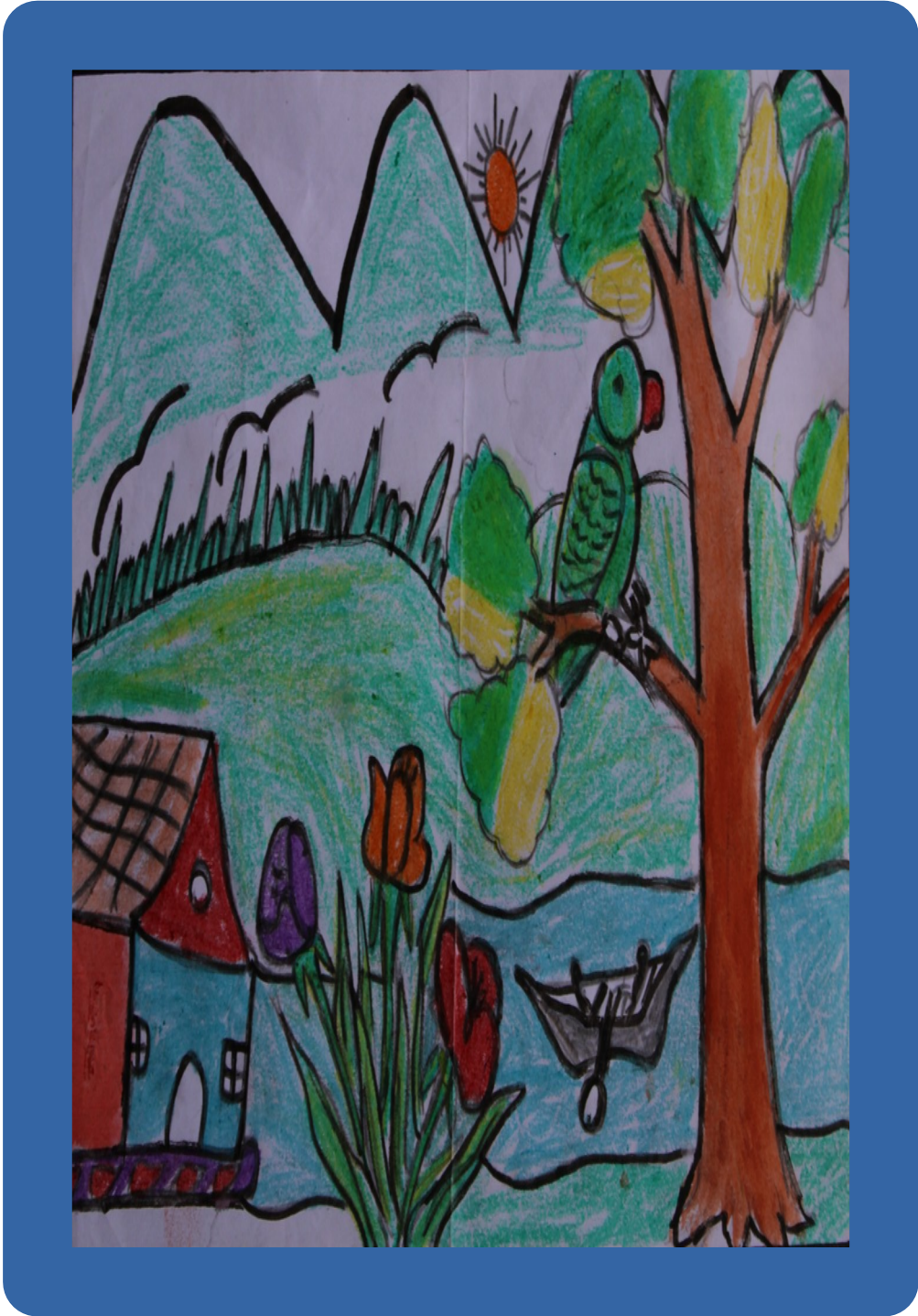
ലിറ്റിൽകൈറ്റ്സ് വി.എം സി ജി എച്ച് എസ് എസ് വണ്ടൂർ