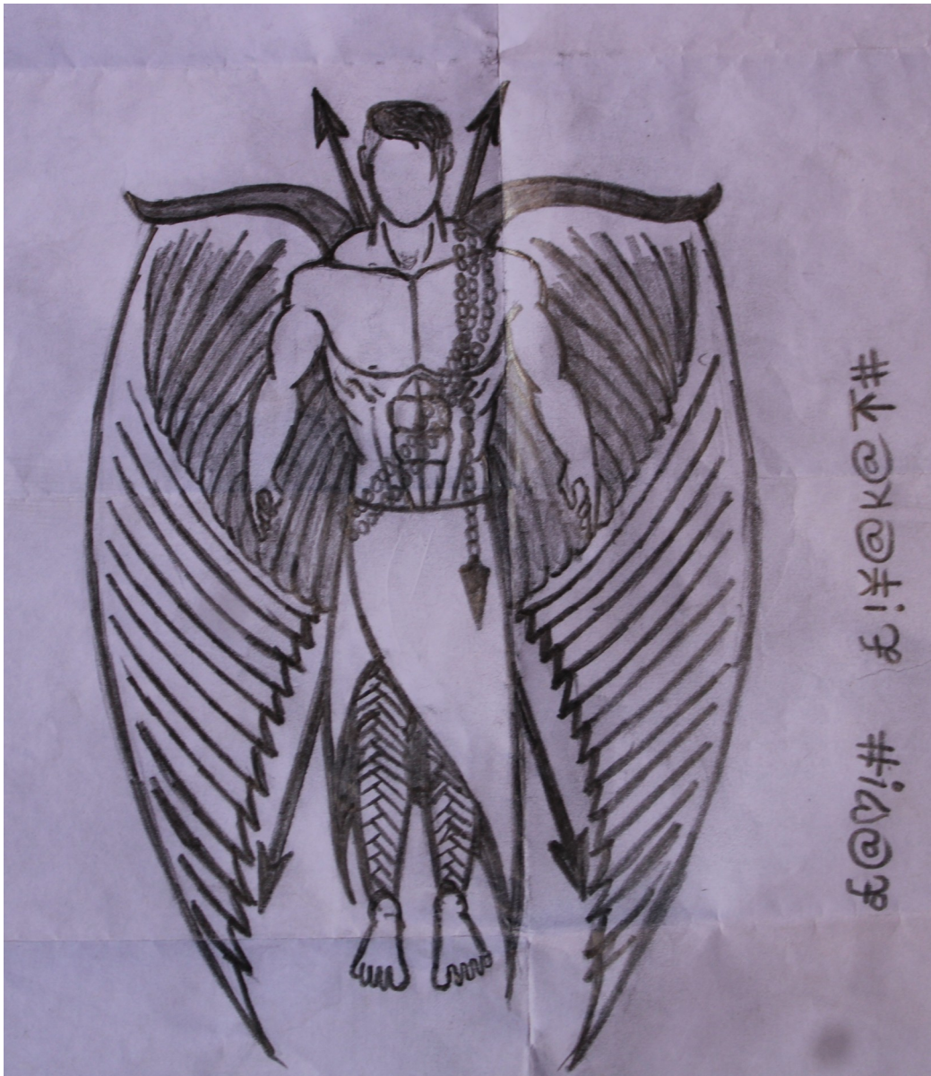
ലിറ്റിൽകൈറ്റ്സ് വി.എം സി ജി എച്ച് എസ് എസ് വണ്ടൂർ