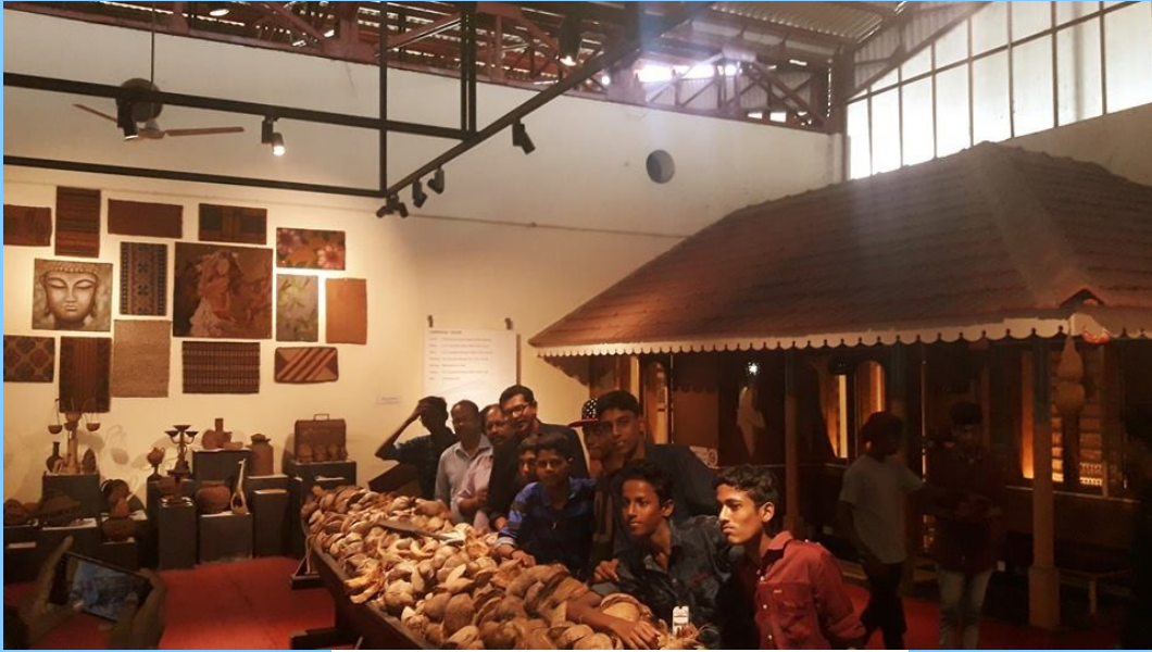
ആലപ്പുഴ കയർ മ്യൂസിയം