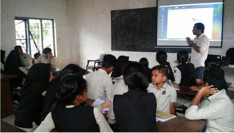
ലിറ്റിൽ കൈറ്റ്സ് ക്ലാസ്സ്