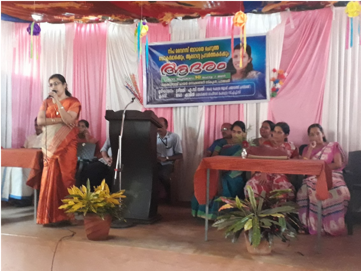
നിപ്പ പ്രതിരോധപ്രവർത്തകർക്കുള്ള ആദരം