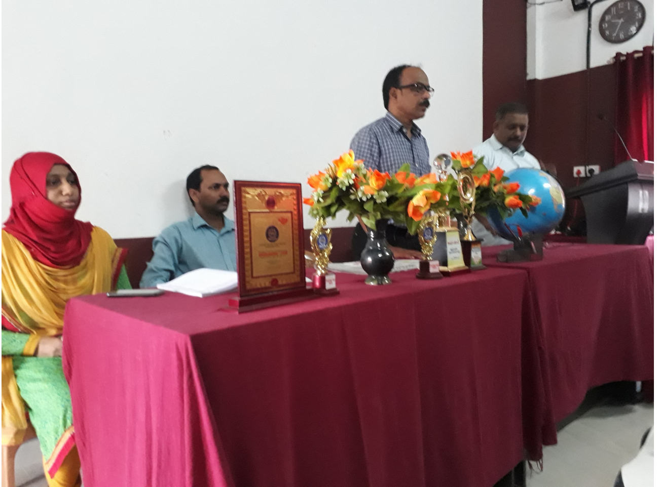
ലിറ്റിൽ കൈറ്റ്സ് ക്യാമ്പ് ഉദ്ഘാടനം