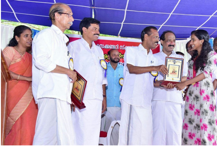
SSLC ഉന്നതവിജയികൾക്കുള്ള അനുഭവദാനം - ശ്രീ. ടി.പി. രാമകൃഷ്ണൻ (ബഹു. തൊഴിൽ എക്സൈസ് വകുപ്പ് മന്ത്രി)