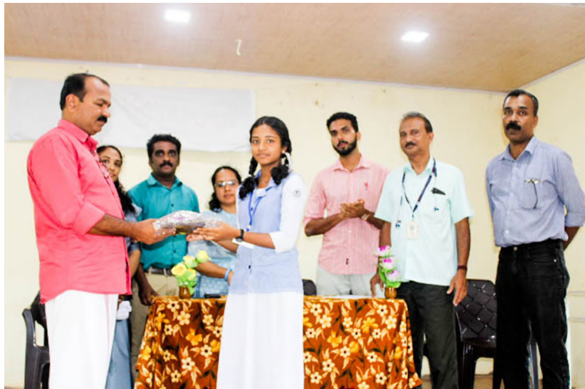
LITTLE KITES K N HSS - INAUGURATION OF UNIFORM DISTRIBUTION