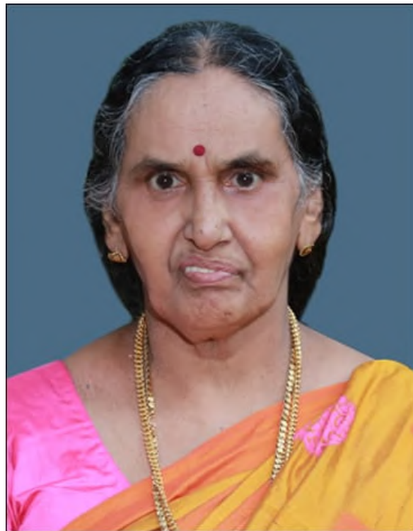
സുധ പി ടി