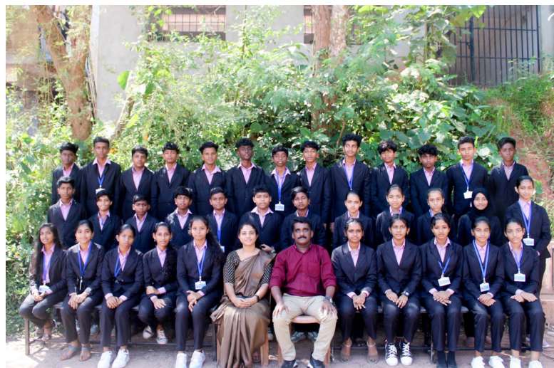
LITTLE KITES K N HSS - 2022 -2025 BATCH