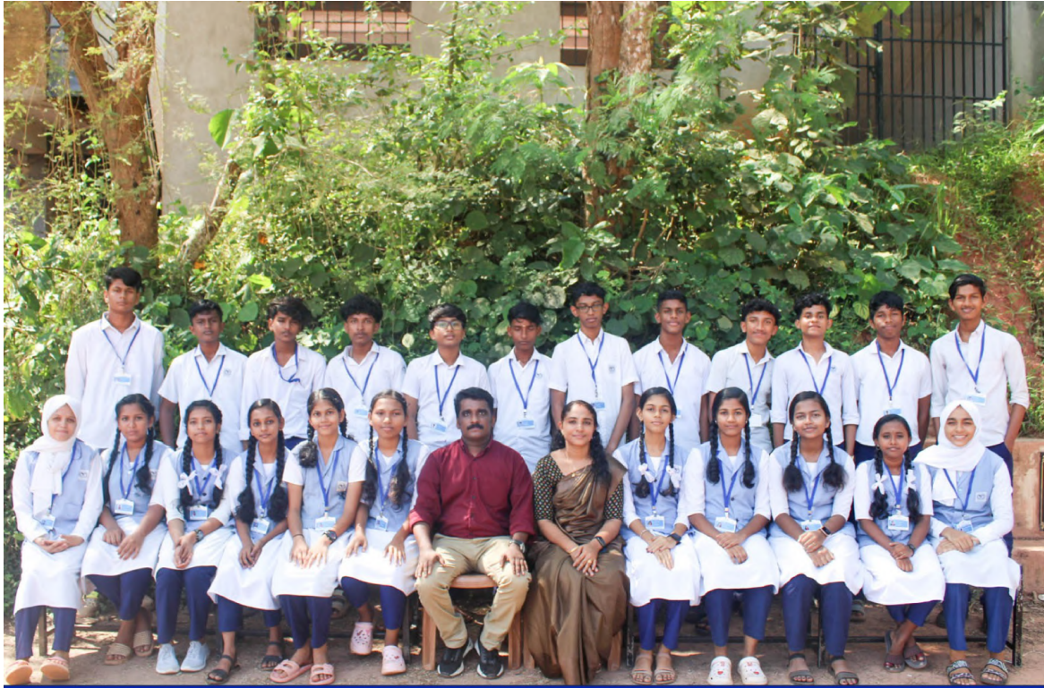
LITTLE KITES K N HSS - 2021 -2024 BATCH