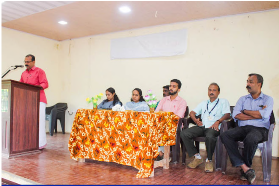
LITTLE KITES K N HSS - INAUGURATION OF UNIFORM DISTRIBUTION