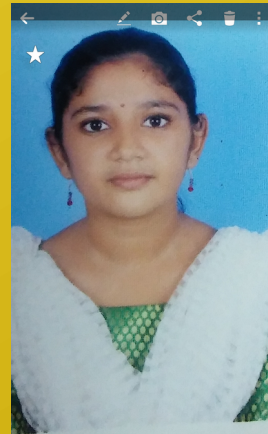
അക്ഷയ ആർ കുമാർ