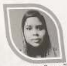
ഹൃദയന സി ഏച്ച് 10, A