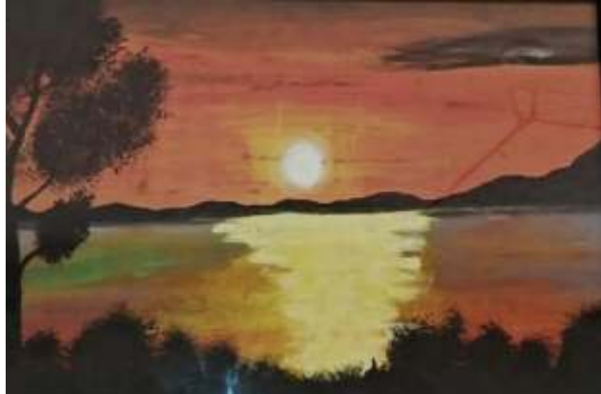
നജ ഫാത്തിമ 9 D