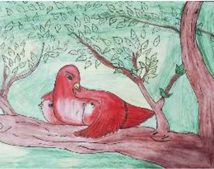
ഫർഹ 9 D