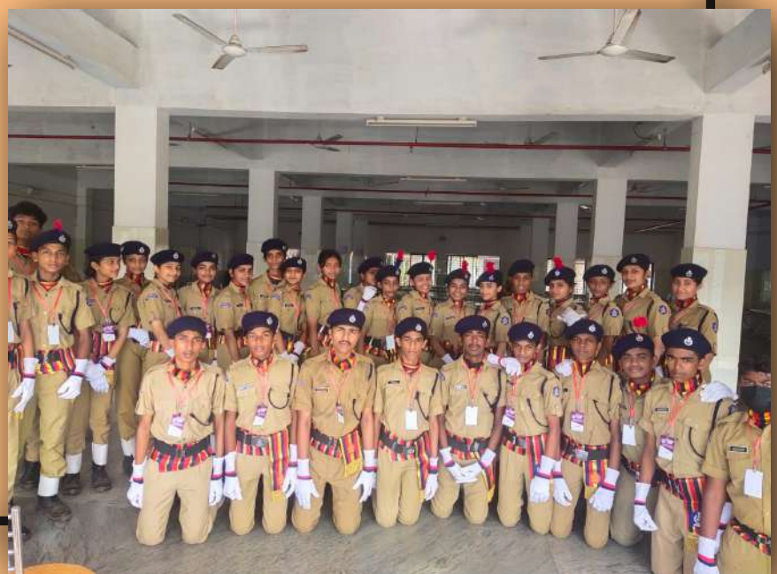
Our SPC Cadets