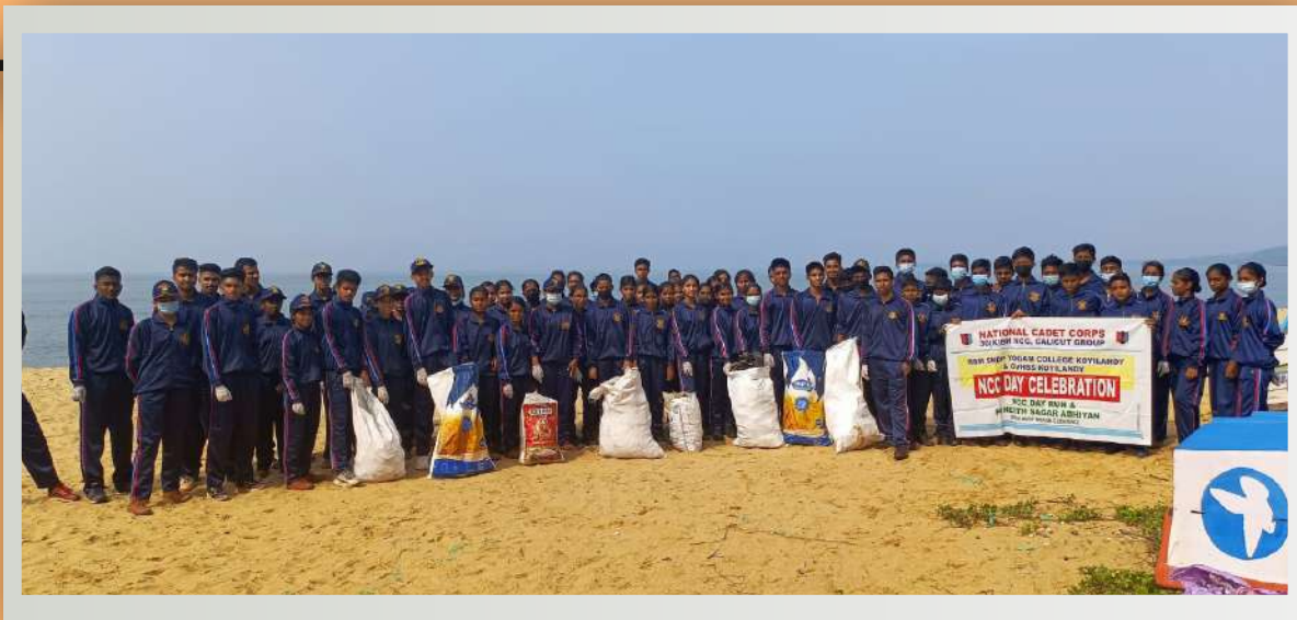
NCC Cadets beach cleaning on NCC day