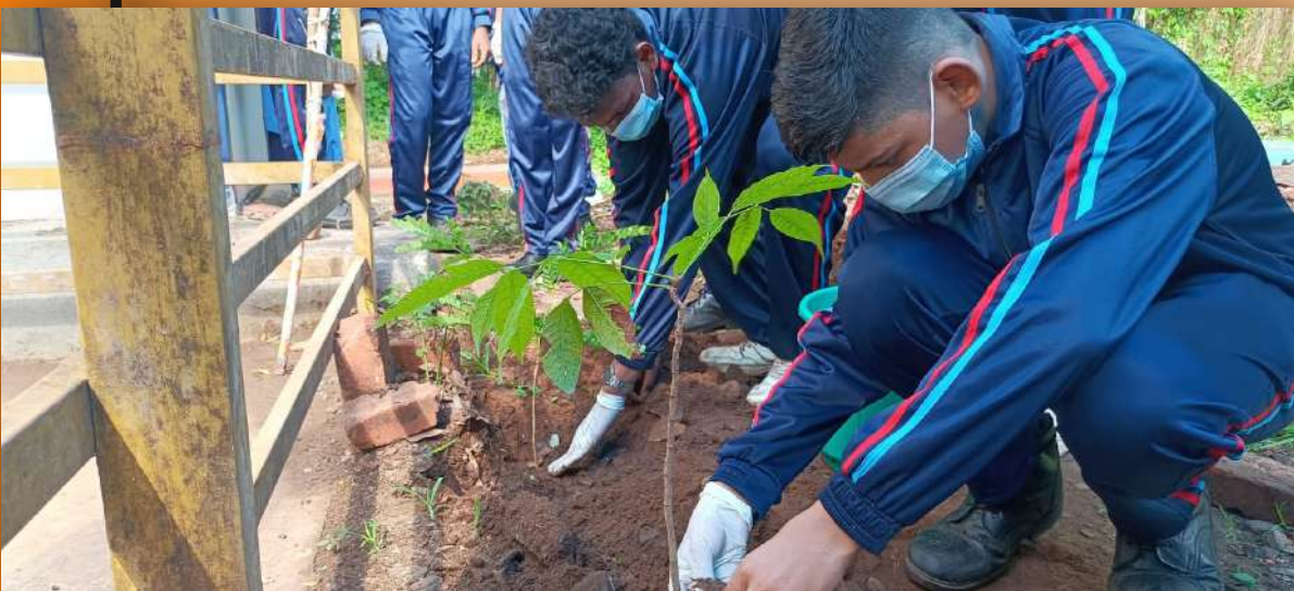
NCC cadets planting saplings