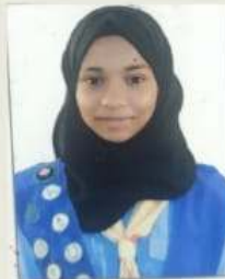
FASNA T. F