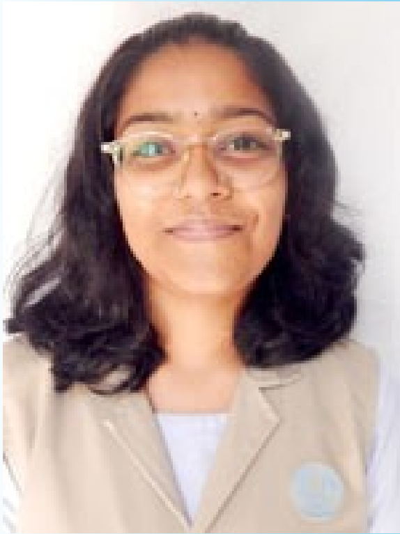
ദിയ എം പി