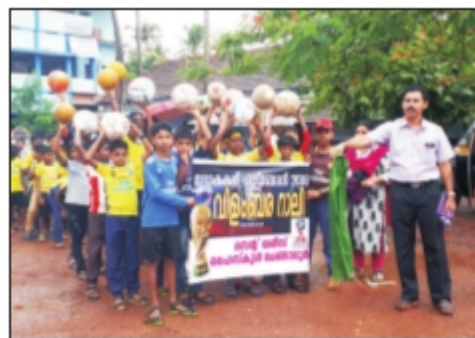
ലോകകപ്പ് വിളംബര നാലി