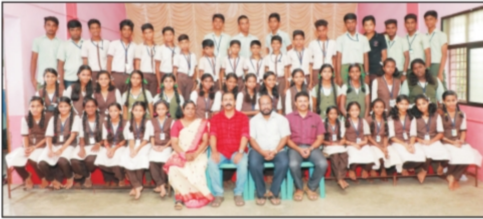
ഉപജില്ലാ കായികമേളയിൽ റണ്ണർ-അപ്പ് നേടിയ സ്കൂളിലെ കായിക താരങ്ങൾ