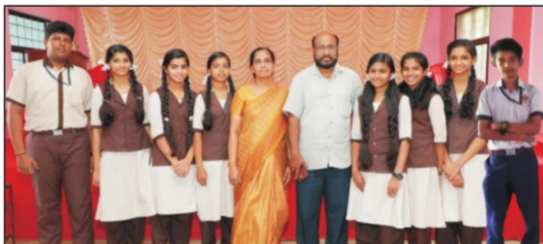
ഉപജില്ലാ ശാസ്ത്രമേളയിൽ മാത്സ് മത്സരിൻ ഒന്നാം സ്ഥാനം കരസ്ഥമാക്കിയവർ