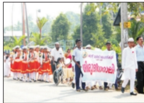
ശിശുദിനത്തോടനുബന്ധിച്ച് നടത്തിയ നാലി