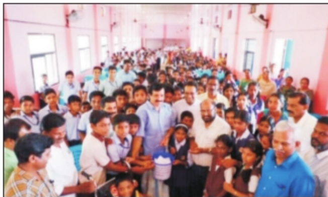
പ്രളയ ദുരിതാശ്വാസനിധിയിലേക്ക് സ്കൂൾ വിദ്യാർത്ഥികളുടെ സംഭാവന ബഹു. വിദ്യാഭ്യാസ ഉത്സാഹി പ്രൊഫ. സി. രവീന്ദ്രനാഥ് ഏറ്റെടുക്കുന്നു.