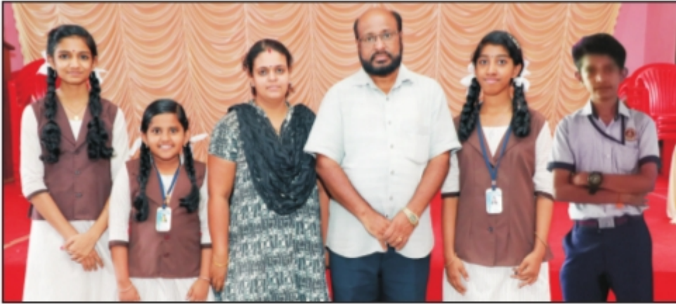
ഉപജില്ലാ വിദ്യാരംഗം മത്സരങ്ങളിൽ വിജയികളായവർ