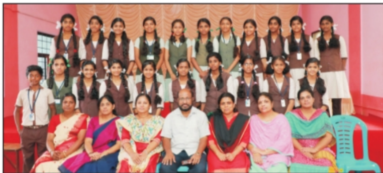
ഉപജില്ലാ കലാത്സവത്തിൽ മികവ് തെളിയിച്ച കലാപ്രതിഭകൾ