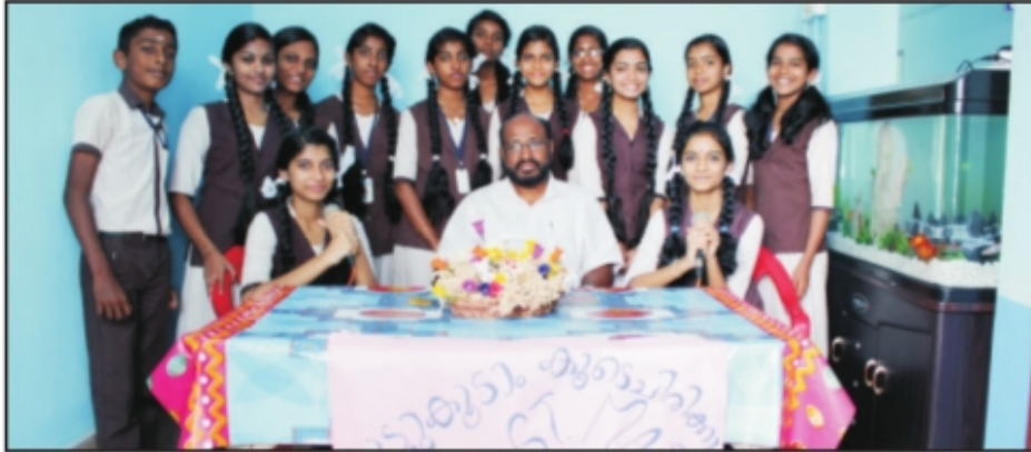
വായ്പ് സെന്റ് മേരീസ് - സ്കൂൾ റേഡിയോ ജോക്കിമാർ