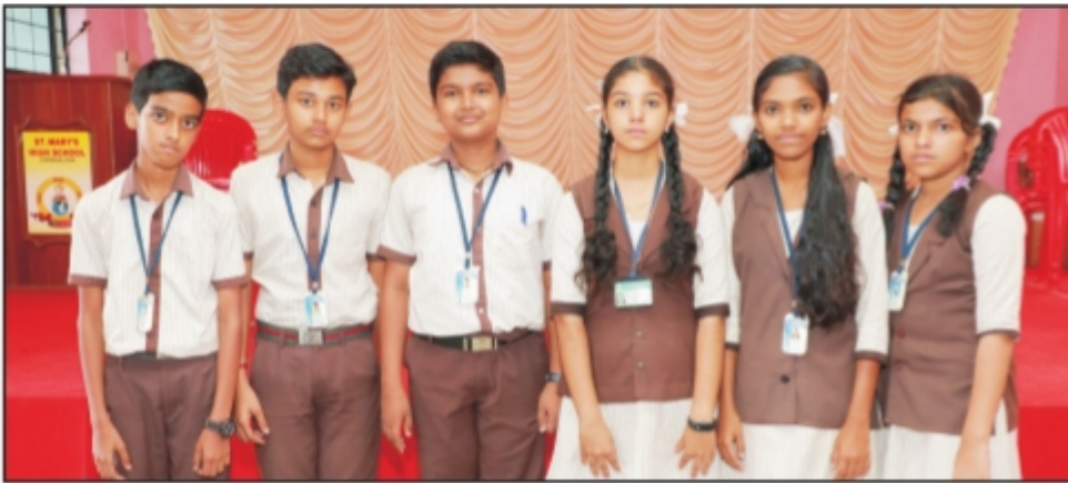
പഞ്ചായത്തത്വ വായന മത്സര വിജയികൾ