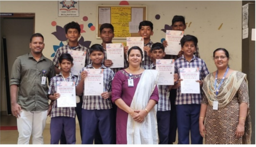
ചാലക്കുടി ഉപജില്ലാ സബ്ജൂനിയർ വിഭാഗം ഹാൻഡ്ബുൾ ഒന്നാംസ്ഥാനം

ചാലക്കുടി ഉപജില്ലാ ശാസ്ത്രമേളയിൽ കുട്ടികൾ സജീവമായി പങ്കെടുക്കുകയും സമ്മാനങ്ങൾ കരസ്ഥമാക്കുകയും ചെയ്തു .പ്രവൃത്തിപരിചയ മേളയിൽ ഓവറോൾ മൂന്നാം സ്ഥാനവും ഗവണ്മെന്റ് സ്കൂളുകളിൽ ഒന്നാം സ്ഥാനവും നേടി