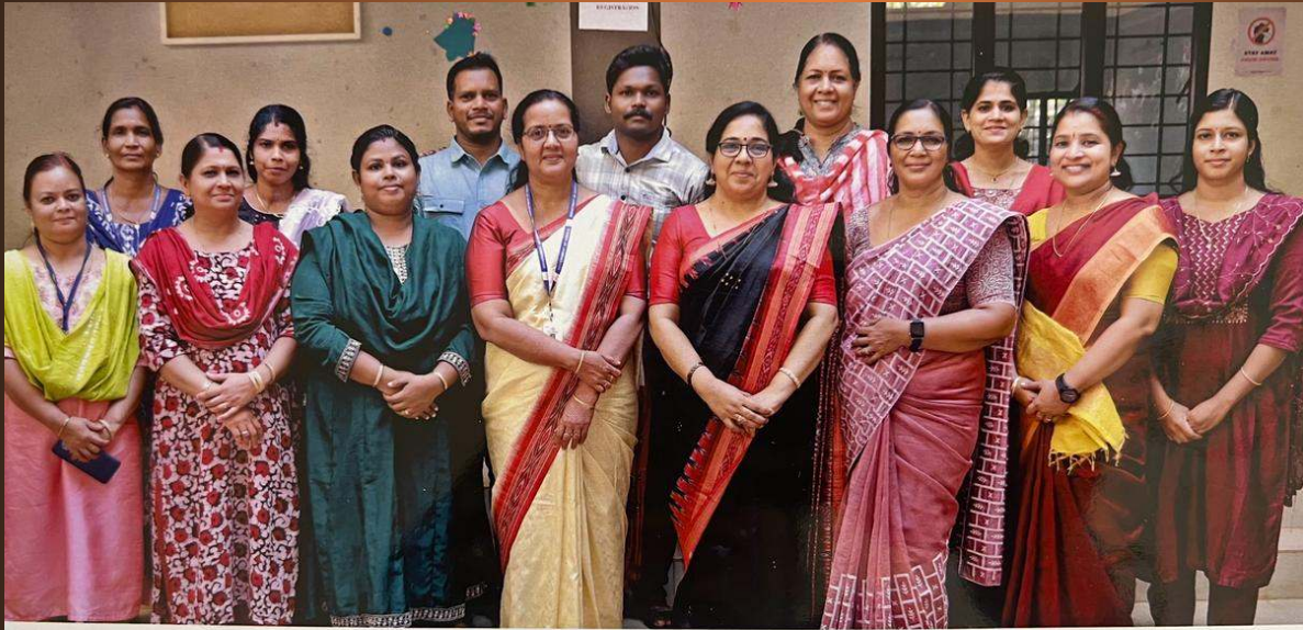
Govt. BOYS HSS CHALAKUDY