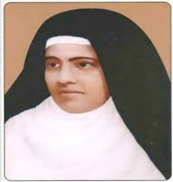
OUR FOUNDRESS MOTHER TERESA OF ST ROSE OF LIMA