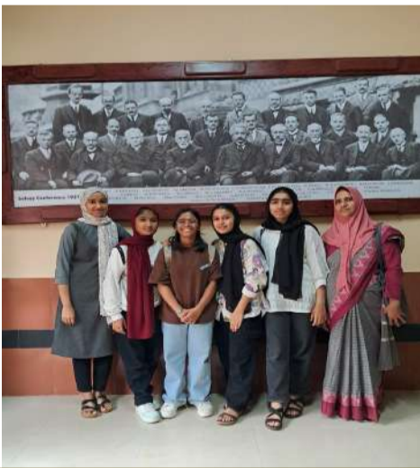
NITC പെൺകുട്ടികൾക്കുള്ള പ്രോഗ്രാം