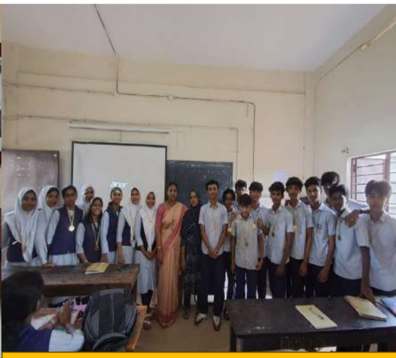
10 ഡിവൈ കുട്ടികൾക്കൊപ്പ്