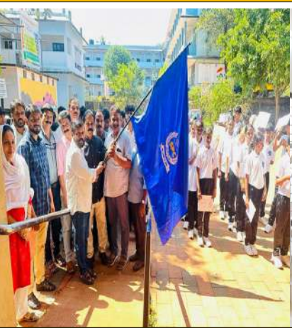
എസ് പി സി