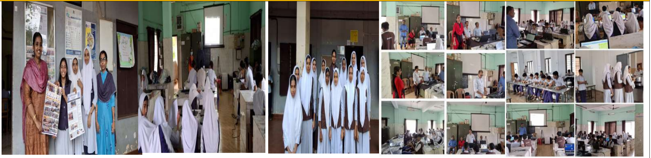
ലിറ്റിൽ കൈറ്റ്സ് യൂണിറ്റ് തല ക്യാമ്പ്