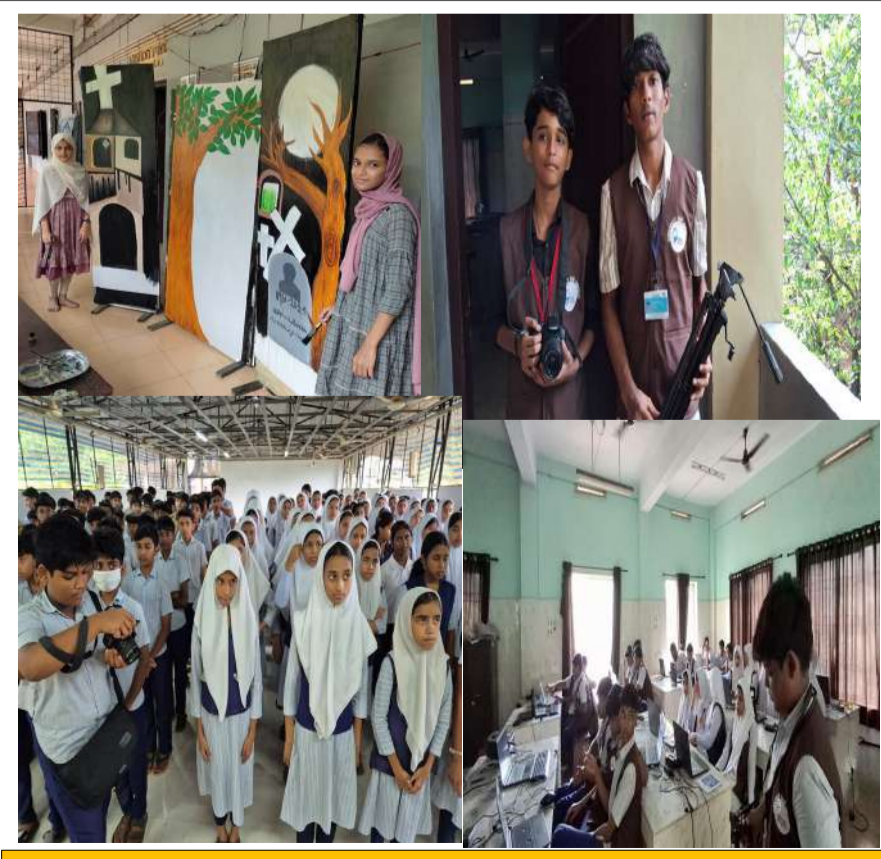
ലിറ്റിൽ കൈറ്റ്സ് വിവിധ പ്രവർത്തനങ്ങളിലൂടെ