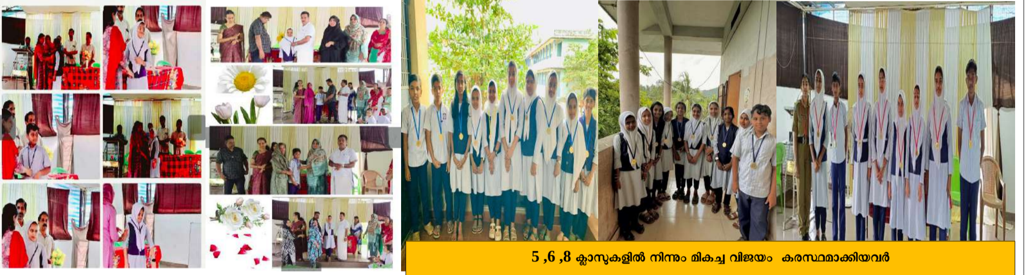
5,6,8 ക്ലാസുകളിൽ നിന്നും മികച്ച വിജയം കരസ്ഥമാക്കിയവർ