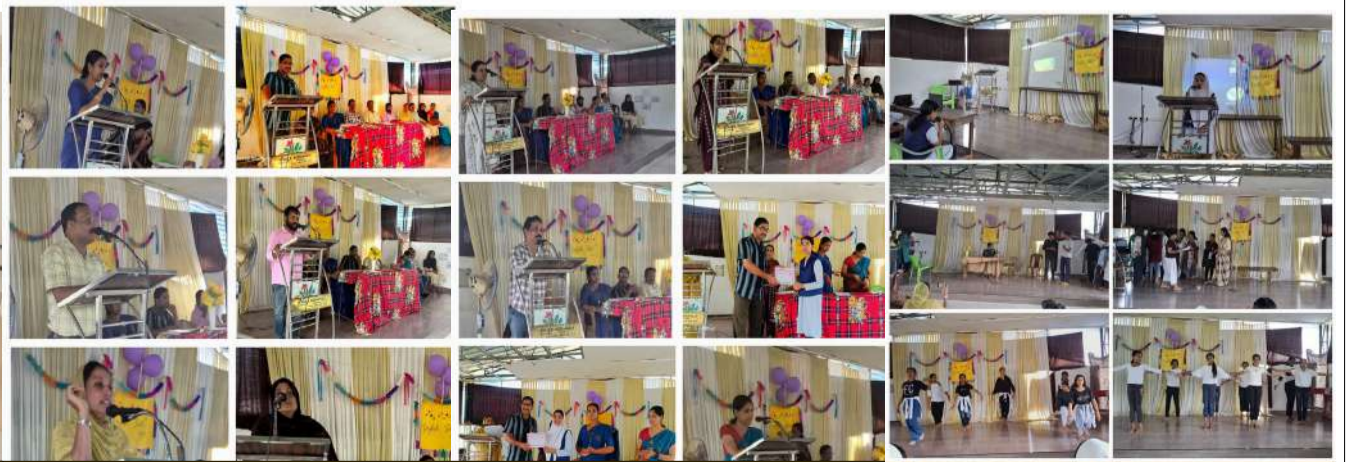
ഇംഗ്ലീഷ് ഫെസ്റ്റ് വിവിധ പരിപാടികൾ