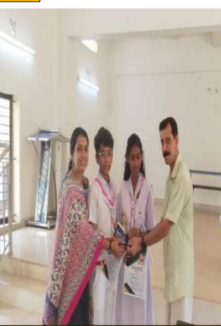
ജെ ആർ സി