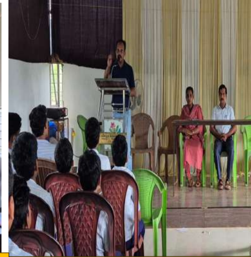
ക്ലാസ് ലിഡേഴ്സിനുള്ള മീറ്റിംഗ്