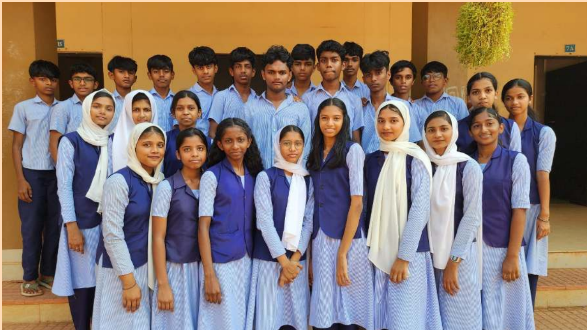
LK 2022-25 BATCH