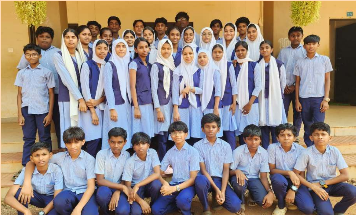
LK 2023-26 BATCH