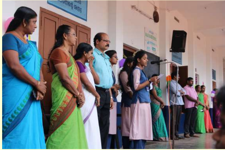
പ്രവേശനോത്സവം 2019 ജൂൺ