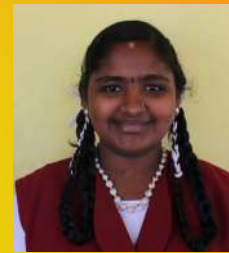
SPOORTHI - 8 th C