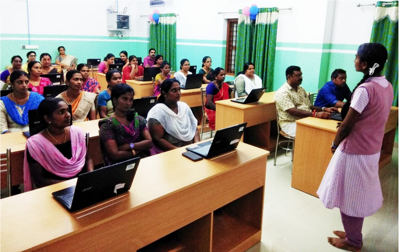
Figure 2: കമ്പ്യൂട്ടർ ബോധവൽക്കരണ ക്ലാസ്സ്