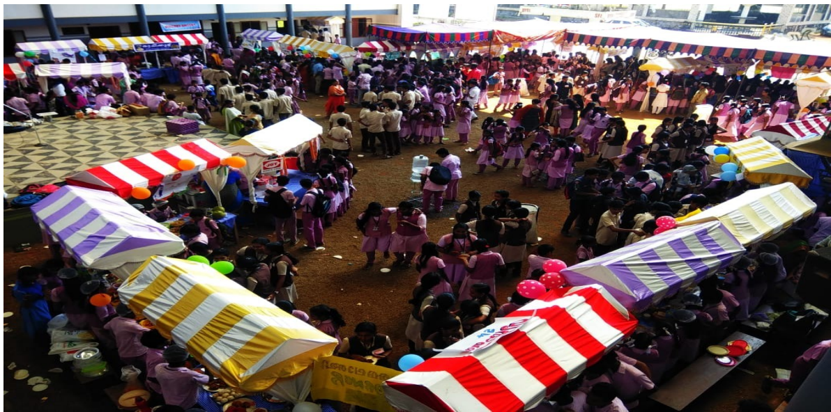
Figure 1: BLASDA 2019