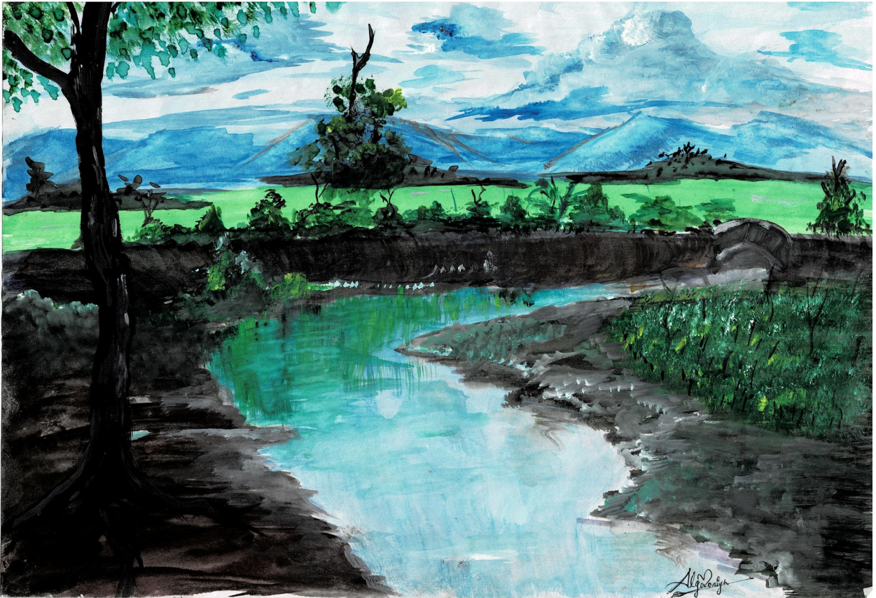
അൽഗ മോനിയ ഷിജു