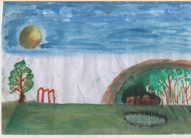
MEHBOOB MUHAMMED -9D