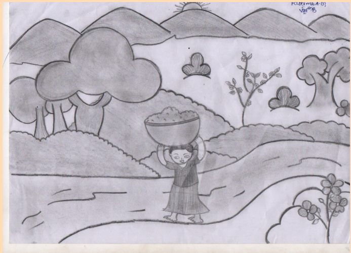
FATHIMA AG- 9B