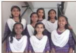
Sangha gaanam ഏകാംഗ്ലിംഗ്