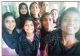
Group song Urdu II A GRADE