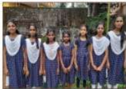
Deshabhakti gaanam II A GRADE