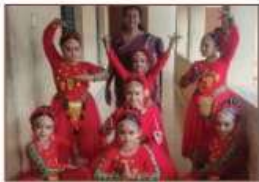
Sangha Nrutham III A GRADE