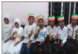
Sangha gaanam A GRADE