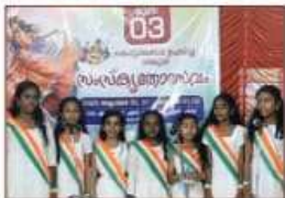
Vande Matharam A GRADE