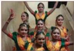
Sangha Nrutham A GRADE