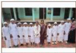
Vattappattu A GRADE