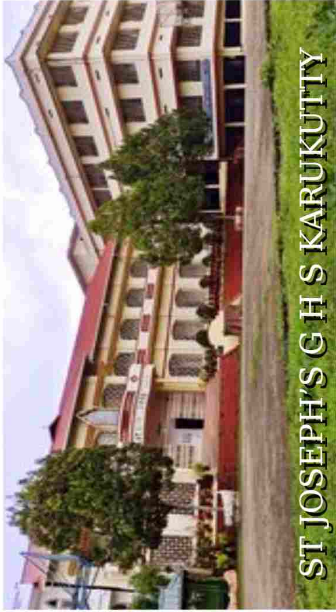
ST JOSEPH'S GHS KARUKUTTY