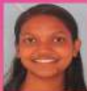
ആൻസിറ്റി IX. സി

ചേമ്പില കടപിടിച്ച് ഫതി നനഞ്ഞാഴുകും പോൾ പുറകെ ഭാസിയ മഴ പൂകടക്കുമ്പോൾ കാതിൽ അടുത്തു കിന്നാരം പറഞ്ഞ മഴ പിണങ്ങി നിൽക്കുമ്പോൾ പടിക്കൽ വന്നു തുരിച്ചു നോക്കുന്ന മഴ പതിയെ ഏകിലും പഴയ നോ വിൻറെ മുറിവിൽ നിറുന്ന മഴ