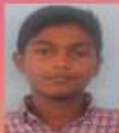
ആനീൻ VIII. E