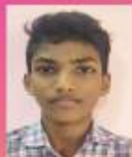
അഖിലൻ IX. C