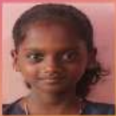
ഹന V. D