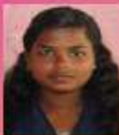
ദേവിക VIII. D