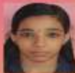
നന്ദന IX. A