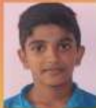
അരുൺ VII. B