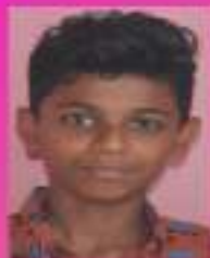
അജോ. മഥൻ VIII. F