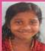
ദേവിത VII. B

അറിവിൻ ലോകം സ്നേഹത്തിൻ ലോകം അതാണ് നമ്മുടെ വിദ്യാലയം സഹപാഠികൾ തൻ സ്നേഹ വർത്തമാനങ്ങൾ അറിവുകൾ പകരം നിമിഷങ്ങൾ നിറയും ചടുലമായ അറിവിനെ സ്വായത്തമാക്കാൻ നിറഞ്ഞു ദീപമാണ് വിദ്യാലയം വിദ്യ പകരം അധ്വപകർ തൻ ശിഷ്യമായി മാറുന്നു മോഹൻ ജീവികളായി മാറുന്നു , കുട്ടികൾ അറിവിൻറെ ലോകത്തെ കീഴടക്കാൻ ആർക്കെ സാധ്യമല്ല ഇനിയുമേറെ പഠിക്കണം വിദ്യാലയം