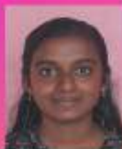
ആദ്യ IX. B