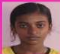
ജിയ.എസ് VII. ബി