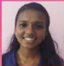
അർച്ചന IX. C