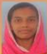
ഹസ്സ VIII. E