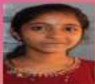
ഗൗരികൃഷ്ണ VIII. C