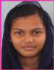
ഇദ്ദ ഫാത്തിമ V. B