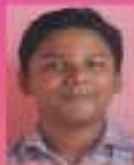
അനൂപ് IX. E