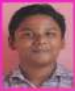
അനന്ദപി.എസ് IX. E