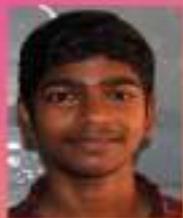
ആരോമൽ. ആർ VIII. C