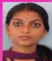
കൃഷ്ണ IX. A