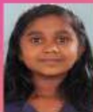
അനന്യ VI. A