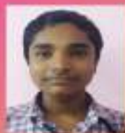
വിഷ്ണു X. E