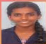
സാൺ. IX. E