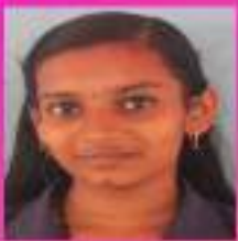
അരുൺ IX. A