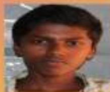
മഹിതൻ IX. A