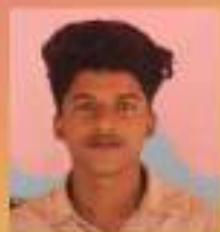
സഫീർ X. D