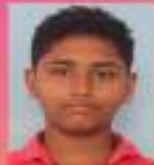
അനന്ദൻ IX. E