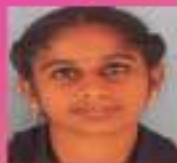
ദീപ VIII. A