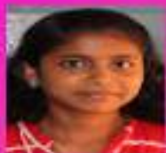
അമൃത .ഫാരി IX. A