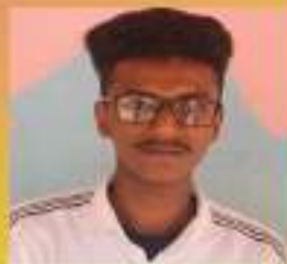
പവിൻ.എ X. D