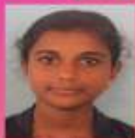
സയന.എസ് VIII, F