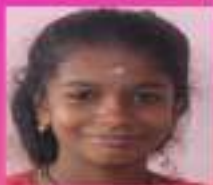
ദേവനദ VII. D