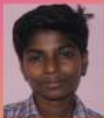
ഗിരീധർ VIII. D