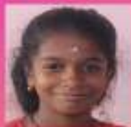
ദേവനൻ VII. ബി