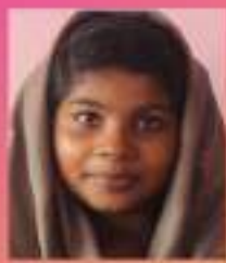
ഹന്ന .ഏൻ VII. C