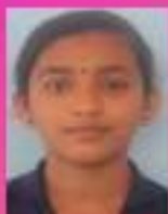
ഗോപിക VIII. E