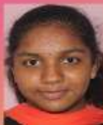
അണ്ണു . അബി VIII. F