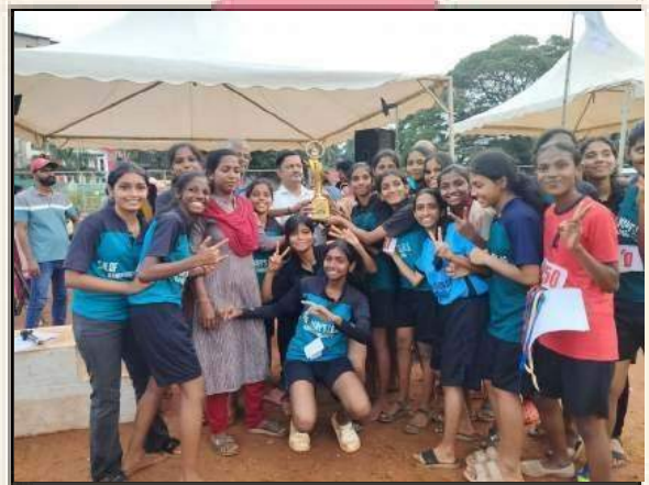
OVERALL 1 st -SPORTS