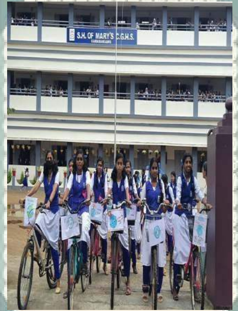
OZONE CYCLE RALLY